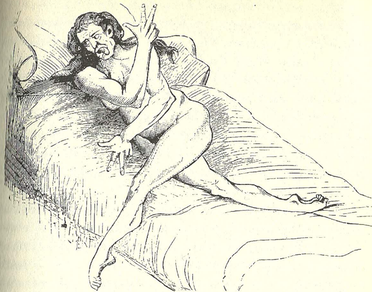
Jean Martin Charcot, Invention de l'hysteria (Objev hysterie) , c. 1880

Bez ohledu na Charcota a Freuda divadlo ve skutečnosti představovalo jednu z mála uměleckých sfér, v níž mohly