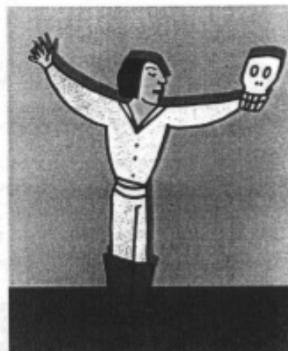
„Być albo nie być, oto jest pytanie”.