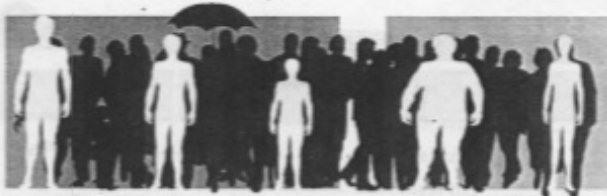
1. wysoki 2. średniego wzrostu 3. niski 4. gruby 5. szczupły