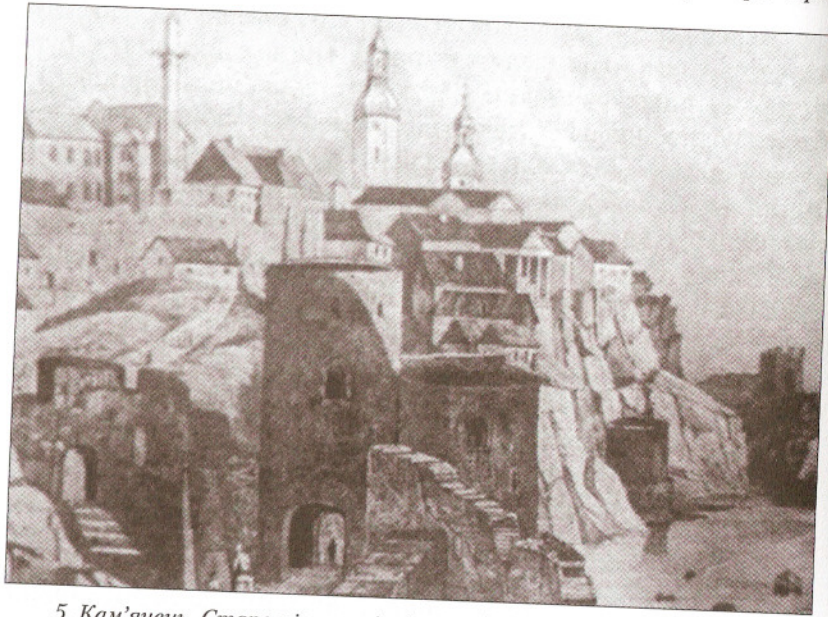
5. Кам'янець. Старе місто з північного боку. Фото з гравюри XVII століття (Історія міст і сіл Української РСР. Хмельницька область. К.: Інститут історії АН УРСР, Головна редакція УРЕ АН УРСР, 1971, с. 299)

Оце намагання сповістити чимбільше людей про факт зачарування, не звертаючись до суду, наштовхує на думку про те, що плітку могли використовувати як протидію чарам. Схоже, жертва чаклунства вважала за необхідне натякнути потенційній відьмі, що їй відомий винуватець нещастя. Це мало би змусити відьму відвернути чари і зцілити свою жертву 104 , наприклад забрати насланого злого духа у випадку з горопашним Лободзинським. З іншого боку, плітки могли переказувати й для того, щоб якнайширше поінформувати громаду про відьму і в разі особливої небезпеки ініціювати самосуд. Ще одна можлива причина – зіпсувати репутацію ймовірної відьми, адже такі плітки не проходили непоміченими для загалу. Лора Гавінг у своїй праці, присвяченій справам про наклеп у ранньомодерному Лондоні, стверджує, що плітки виступали не так регулято-