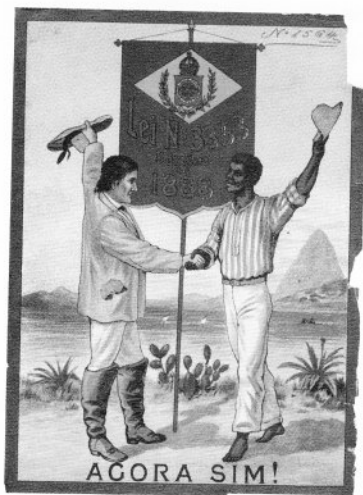
Ainda não: o cartaz feito por uma companhia de tecidos em agosto de 1888 para celebrar a assinatura da Lei Áurea revela uma situação existente apenas no imaginário.