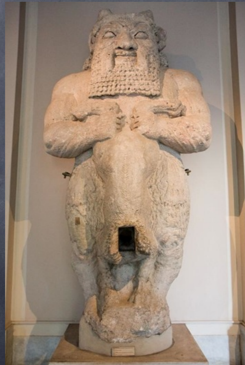
Bůh Bes