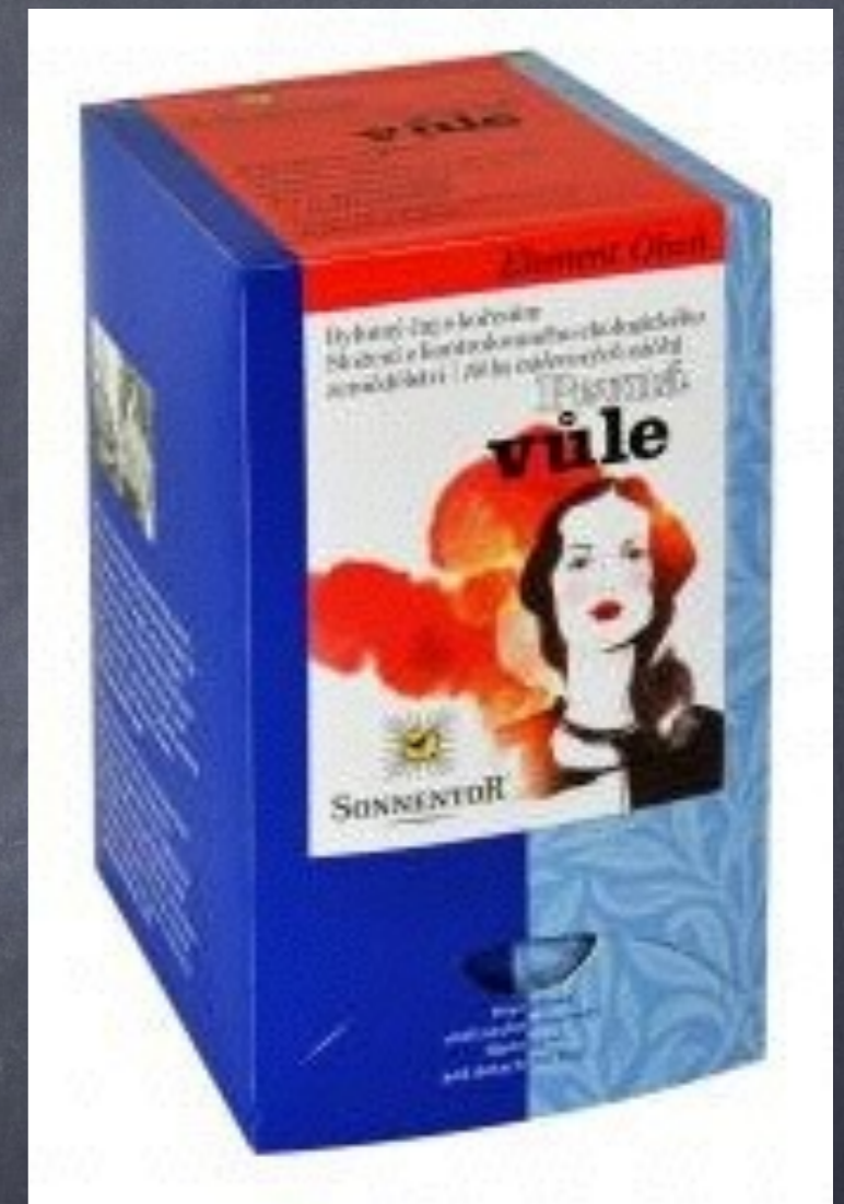
Čaj "Pevná vůle sv. Hildegardy"