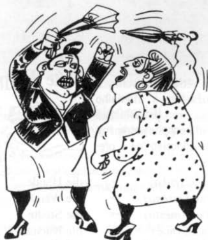
die W e i b e r

1 v některých odborných významech (např. astronomischer, geometrischer Ort) se však užívá tvaru Ört(er).