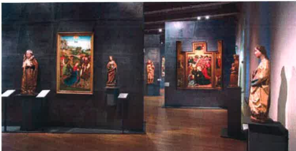
Pohled do dlouhodobé expozice Středověké umění v Čechách a střední Evropě , Národní galerie v Praze, Klášter sv. Anežky České. "Medieval Art in Bohemia and Central Europe", National Gallery in Prague, Convent of St Agnes of Bohemia.

„nového britského umění“ („Young British Artists“), jež lze vnímat z podstatné části právě jako „značku“ – výsledek cílevědomé marketingové strategie s cílem profilovat určitou značku v kontextu globalizované umělecké scény a využít ji v rámci marketingu země. Jak ostatně britský ministr kultury v roce 1998 otevřeně prohlásil: „Kreativita, kultura a národní identita a budoucí prosperita země jsou nedílně propojeny.“ 24