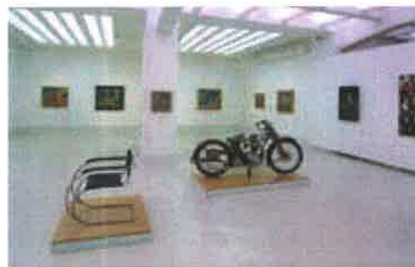
Pohled do dlouhodobé expozice umění 20. století Národní galerie v Praze ve Veletržním paláci. View of the long-term exhibition "Art of the 20th Century", National Gallery in Prague, Trade Fair Palace.

nologicky, ale též opozicí „národní“ versus „evropské“. Řídicím principem tohoto hybridu zůstává lineární pojetí dějin umění. Umístění sbírky asijského umění na zbraslavském zámku („mimo“ mapu centra Prahy a ostatních expozic NG) je pak neúmyslnou, ale případnou metaforou pro marginální postavení, které je v Čechách umění mimoevropskému přisuzováno. Celkově takové strukturování odpovídá marketingové potřebě zdůrazňování národních kritérií, přitom nejenže postrádá jednotnou vnitřní logiku, ale také zcela rezignuje na adekvátnější reflexi otázek, jež jsme výše položili.