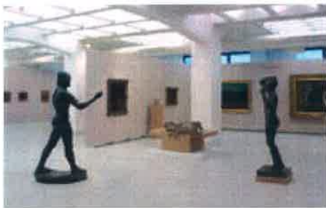
Pohled do dlouhodobé expozice umění 20. století Národní galerie v Praze ve Veletržním paláci. View of the long-term exhibition "Art of the 20th Century", National Gallery in Prague, Trade Fair Palace.