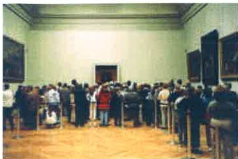
Turisté před Leonardovou Monou Lisou v pařížském Louvru. Tourists in front of Leonardo's Mona Lisa in the Louvre, Paris.

místností, představujících „mikropříběhy“ moderního umění a umožňující nejrozmanitější expoziční záměry. 22 Na druhou stranu je nepochybné, že pro řadu muzeí, vzhledem k specifickému profilu jejich sbírek a vlastní tradici, zůstane tradiční způsob prezentace podle národních škol logickým a smysluplným způsobem strukturování expozic.