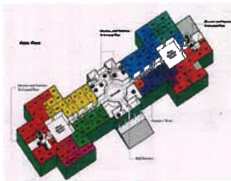
Prostorové uspořádání sálů expozice National Gallery of Art ve Washingtonu. Spatial arrangement of the permanent exhibition in the National Gallery of Art, Washington.

Nejvýrazněji se takové tendence projevují v případě současného umění – jak ukazuje kupř. případ oslavovaného