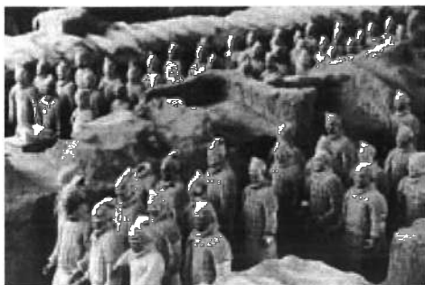
Muzeum terakotových vojáků a koní císaře Čchin Š'-chuanga u Si-anu. Museum of Terracotta Warriors and Horses of Emperor Qin Shi Huang near Xi'an.

další znejasňování hranice mezi „vysokým“ a „nízkým“, vysokým uměním a masovou kulturou; skutečnost, že umění je dnes stále více konzumováno jako součást médií nasycené scény, jako jeden komponent v širokém menu nabídky „prožitků“ a zábavy nabízené spotřebitelům. Velká většina setkání s uměním se odehrává během dovolených či prázdnin jako součást kaleidoskopu zážitků a podívané spojených s cestováním. V prostředí tzv. ekonomiky prožitku nebo ekonomiky pozornosti to jsou editoři lifestylových magazínů a programů, různí marketingoví specialisté a plánovači turistického průmyslu, komunikační agentury a média, kdo předurčují vzorce setkávání s uměním a to, jakému umění se dostane pozornosti, stejnou měrou, ne-li více než kurátoři, kritici a odborníci. 9