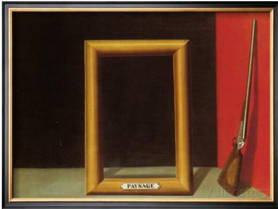
Les charmes du paysage, 1928