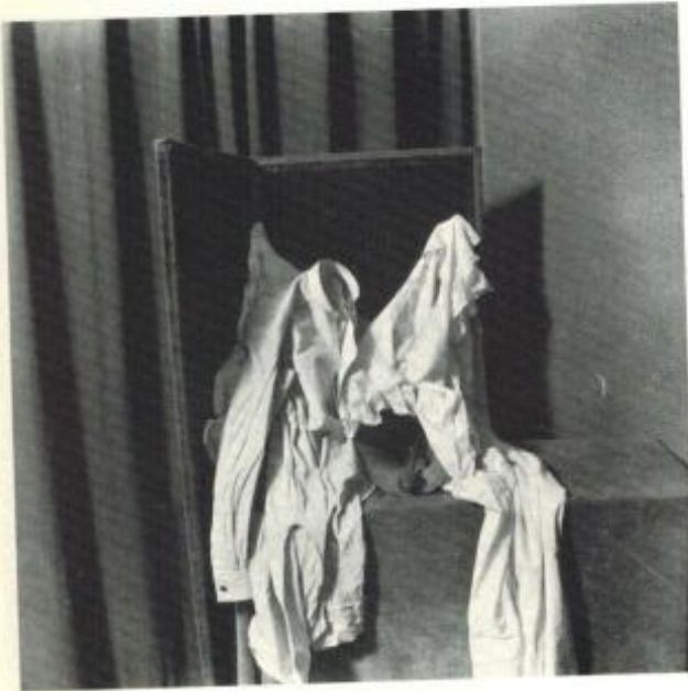
Linges et cloche.