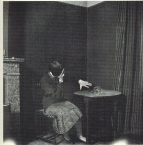
Femme effrayée par une ficelle.