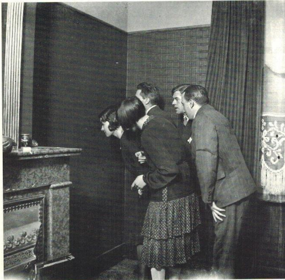
La naissance de l'objet.