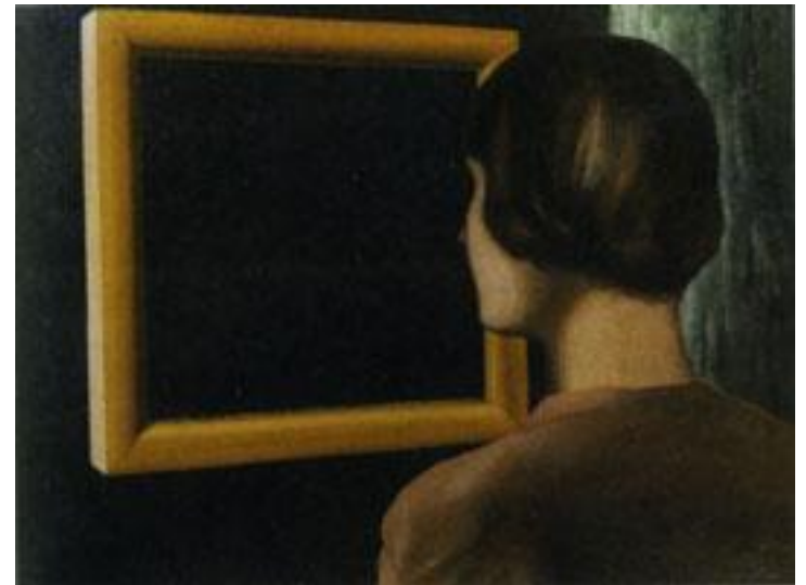
Personnage méditant sur la folie