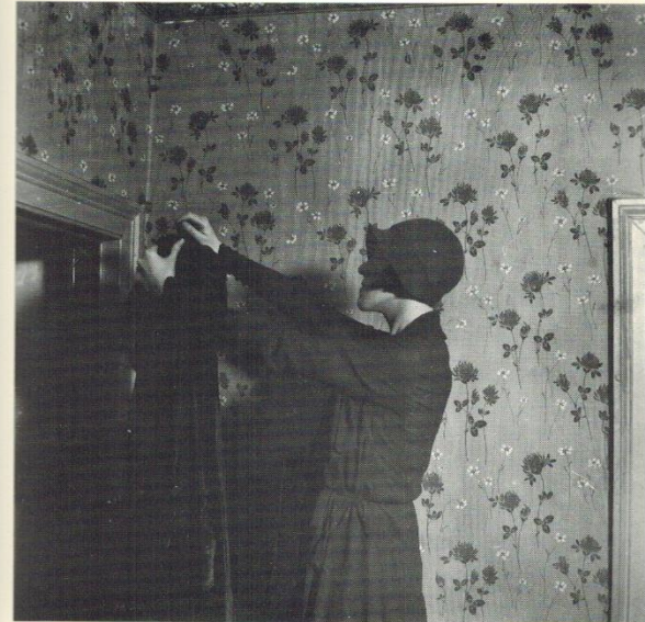
Manteau suspendu dans le vide.