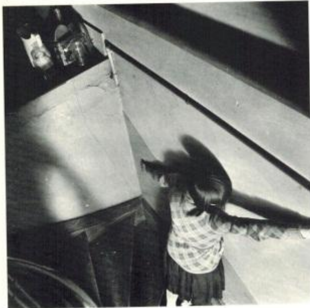
Femme dans l'escalier.