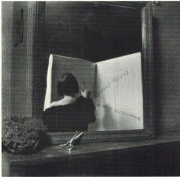
...les oiseaux vous poursuivent.