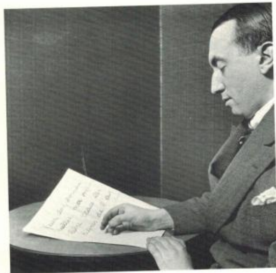
Les vendanges du sommeil.