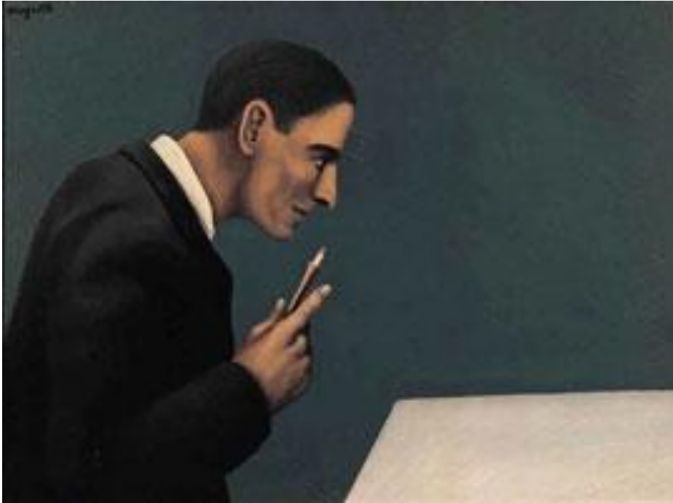
L'image parfaite, 1928