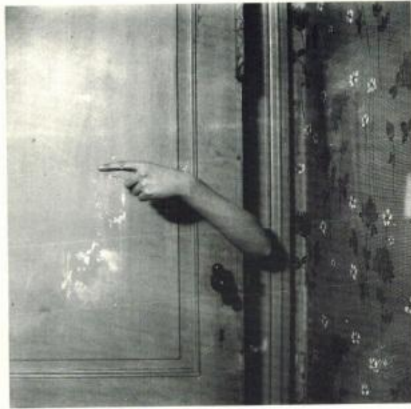
Le bras révélateur.