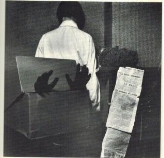
Table aimantée, tombeau du poète.