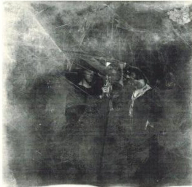
Femmes au miroir.