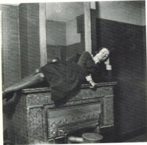
Les profondeurs du sommeil.