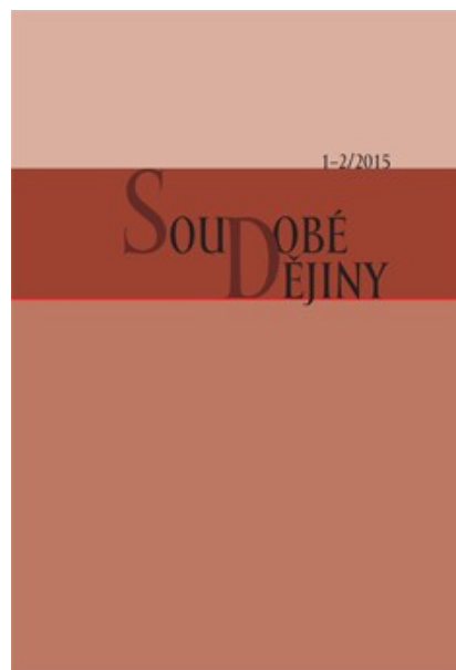
Obr.1 – Porovnání úvodního obalu prvního a posledního (zatím) čísla časopisu Soudobé dějiny.