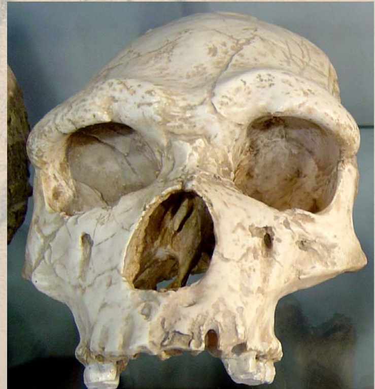
Lebka člověka z Taltaüll