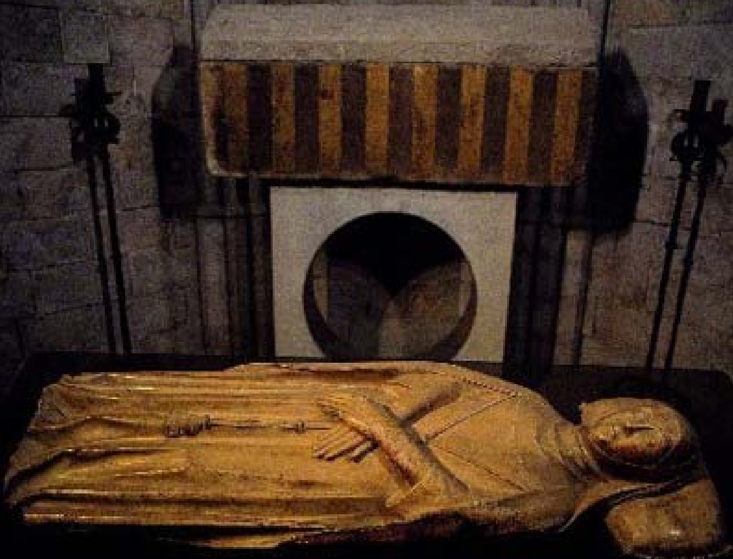
Ermessenda de Carcassona – hrobka v katedrále v Gironě