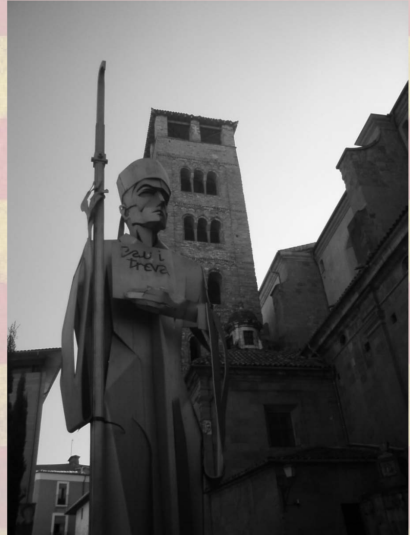
Socha opata Oliby ve městě Vic