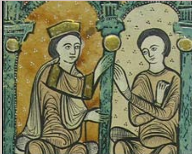
Ramon Berenguer I Almodis de la Marca