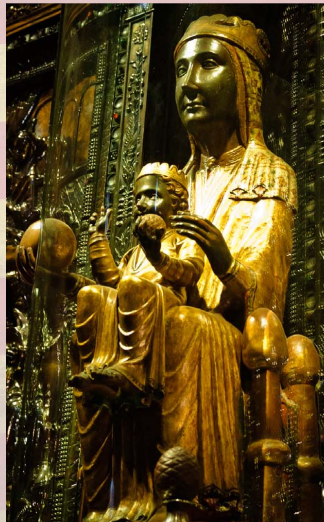
La Moreneta – černá madona, jeden ze symbolů Katalánska. Klášter Montserrat.