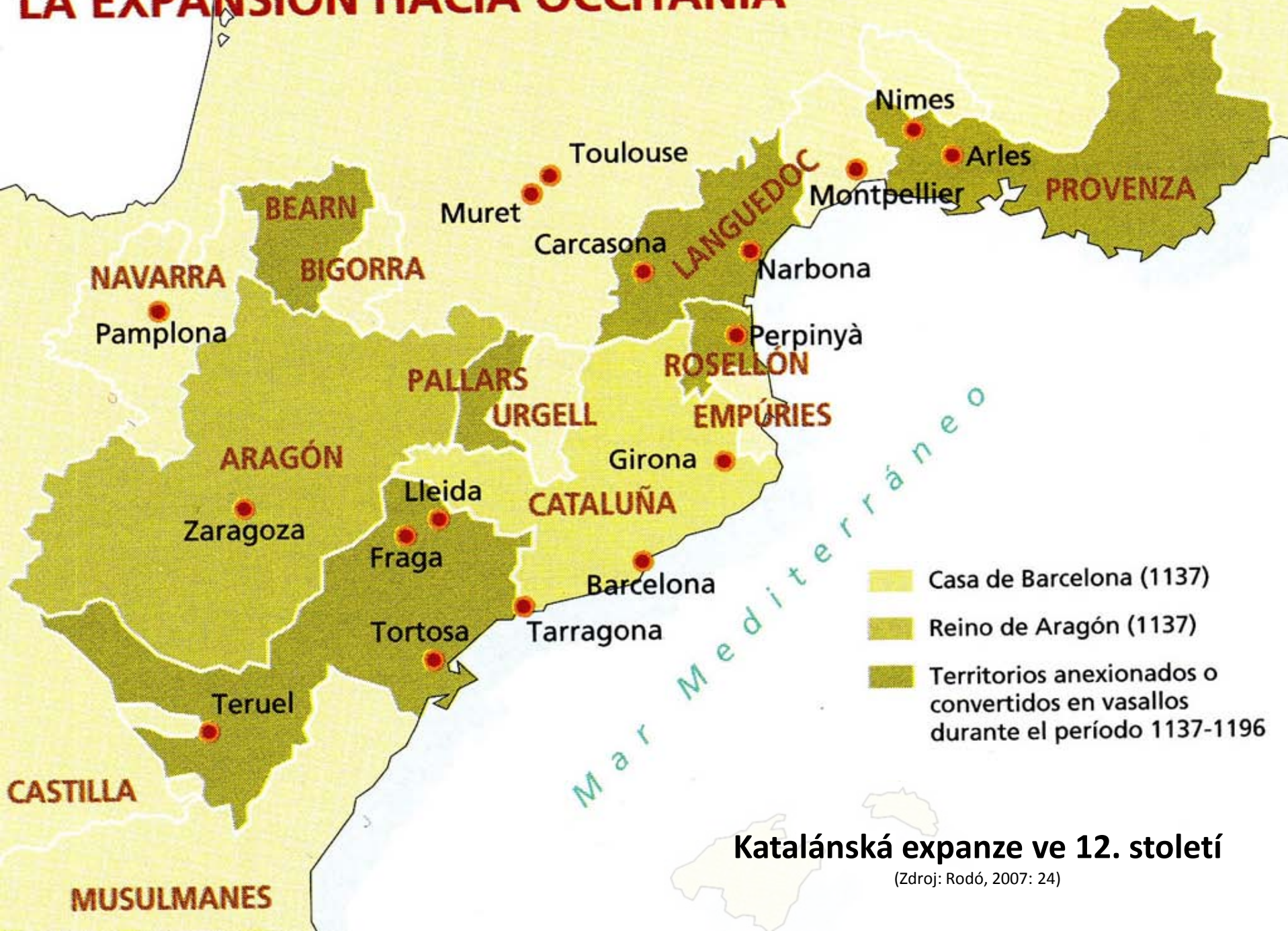
Katalánská expanze ve 12. století