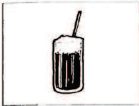
ένας (καφές) φραπέ