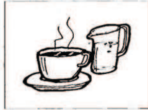
ένα νεσκαφέ με γάλα