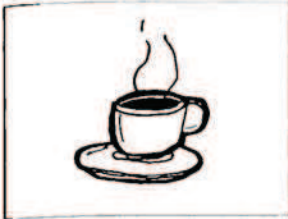
ένας ελληνικός καφές