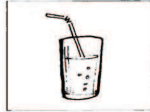
ένας χυμός πορτοκάλι