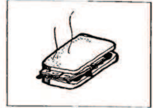
ένα τوست ζαμπόν τυρί