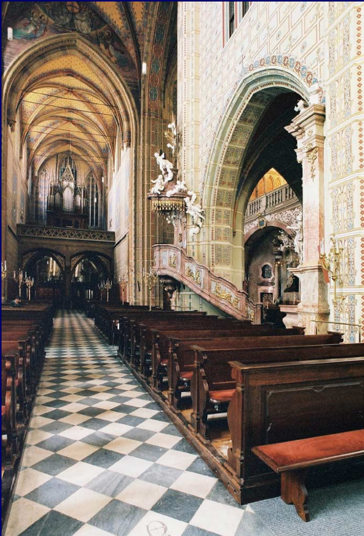
9a. Bazylika WMP – wnętrze