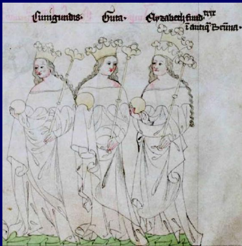
1. Królowe Kunegunda, Guta i Elżbieta (Ryksa jako „bis regina“ – podwójna królowa) Kronika Zbrasławska (1305-1339)