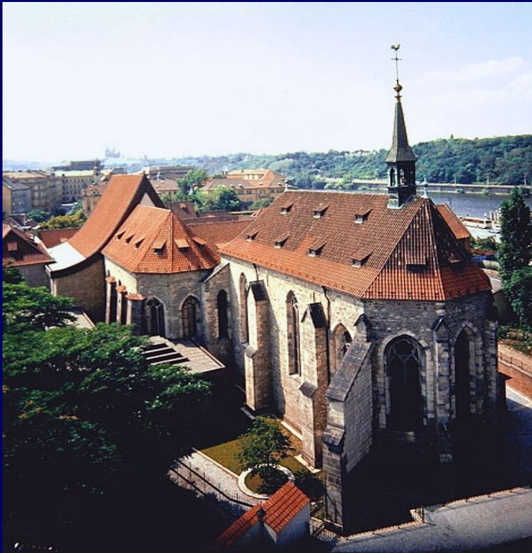
2. Klasztor św. Agnieszki Czeskiej w Pradze na Starym Mieście (fundacja ok. 1231 r., Agnieszka Przemyślidka)