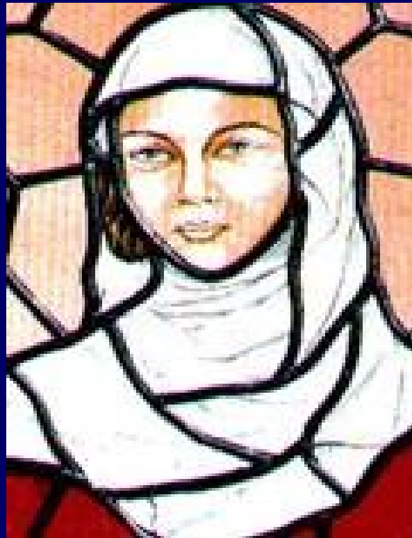
Elżbieta Ryksa (1288–1335)