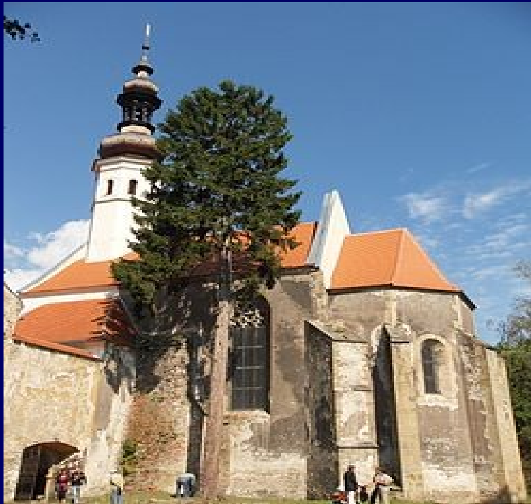
3. Opactwo cysterek w Oslavanach na pld. Morawach – pozostałości (fundacja po 1225 r., margrabina morawska Heilwida)