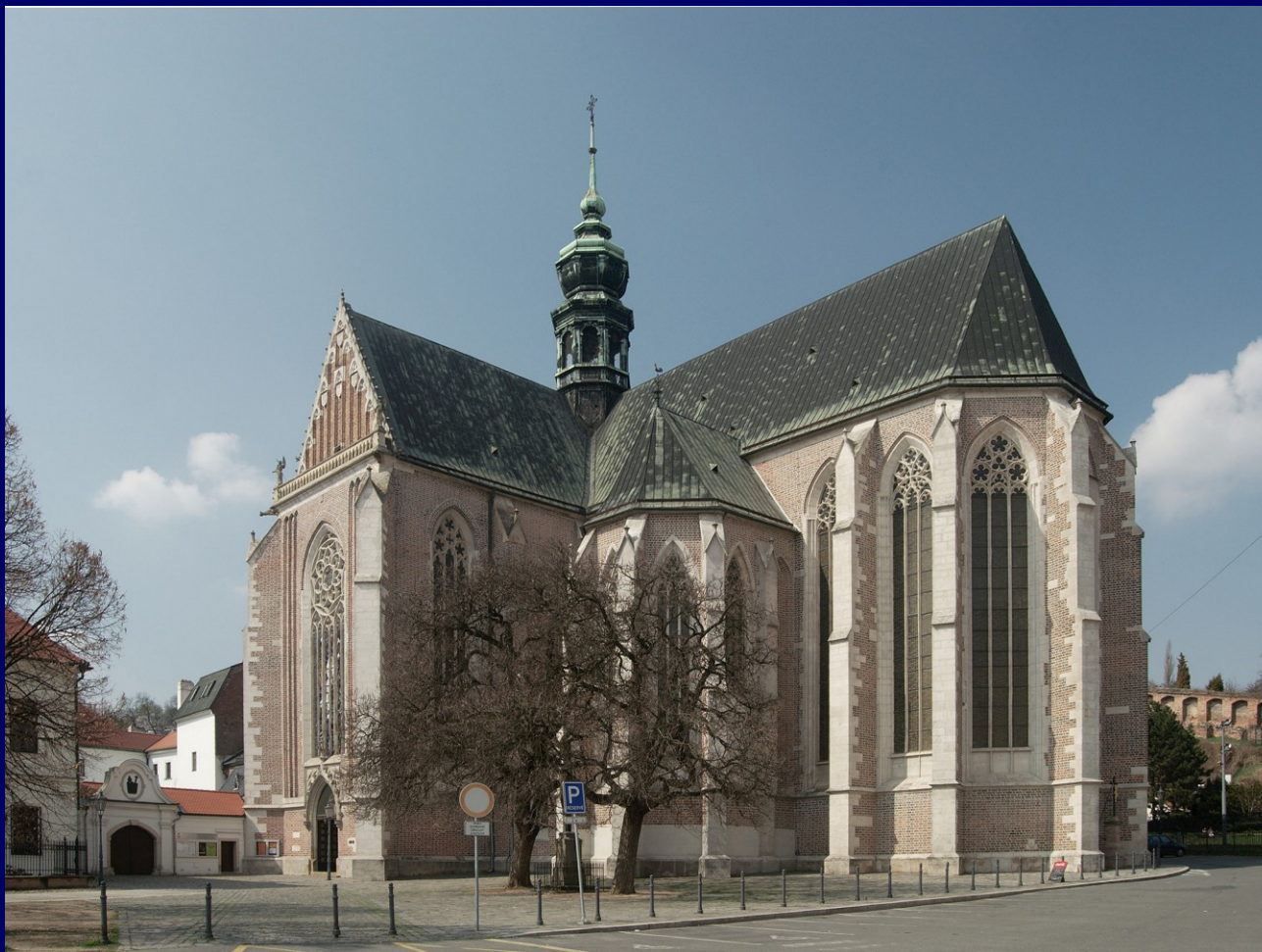
18. Bazylika Wniebowzięcia Marii Panny w Brnie (fundacja 1323 r., Elżbieta Ryksa)