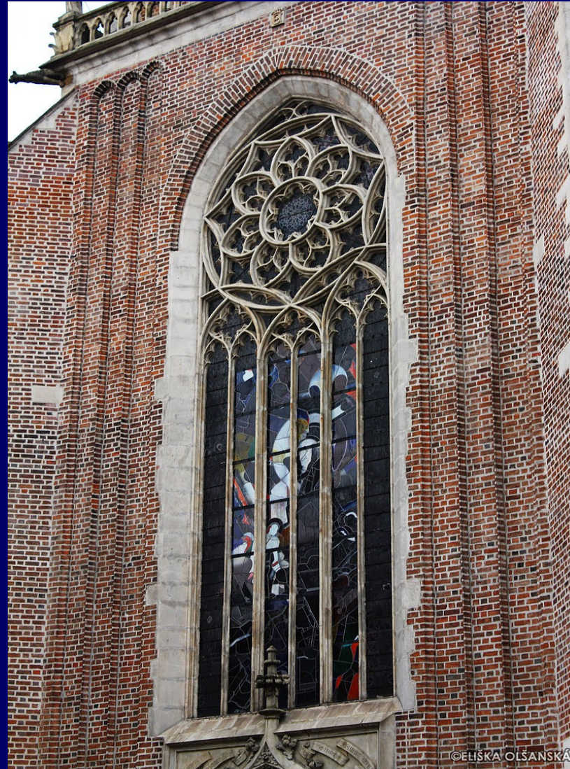
8. Bazylika Wniebowzięcia Marii Panny – okno z rozetą