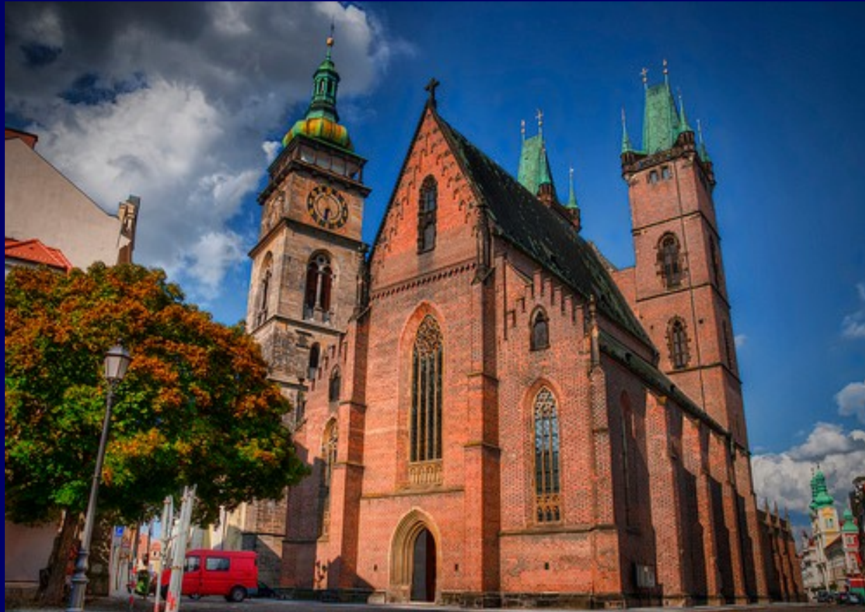
5. Katedra św. Ducha w Hradcu Kralowej (rozpoczęcie budowy obecnego kościoła ok. 1339 r.)