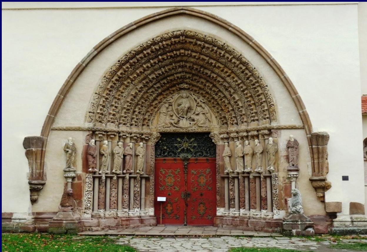
4. Portal bazyliki klasztoru „Porta coeli” w Předklášteří k. Tišnova (fundacja ok. 1230 r., królowa Konstancja)