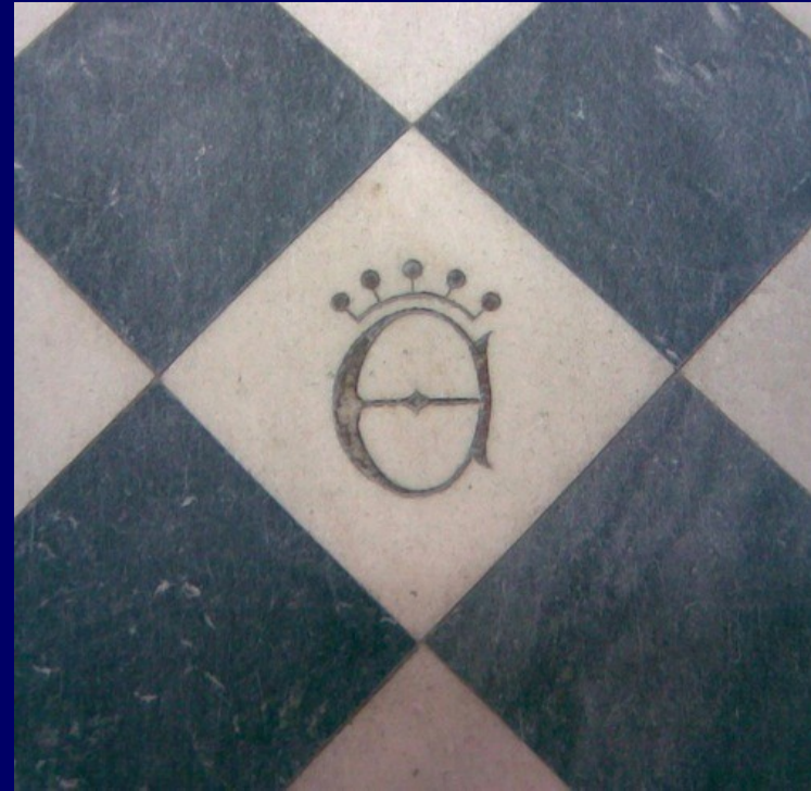
9b. Miejsce pochówku Elżbiety Ryksy