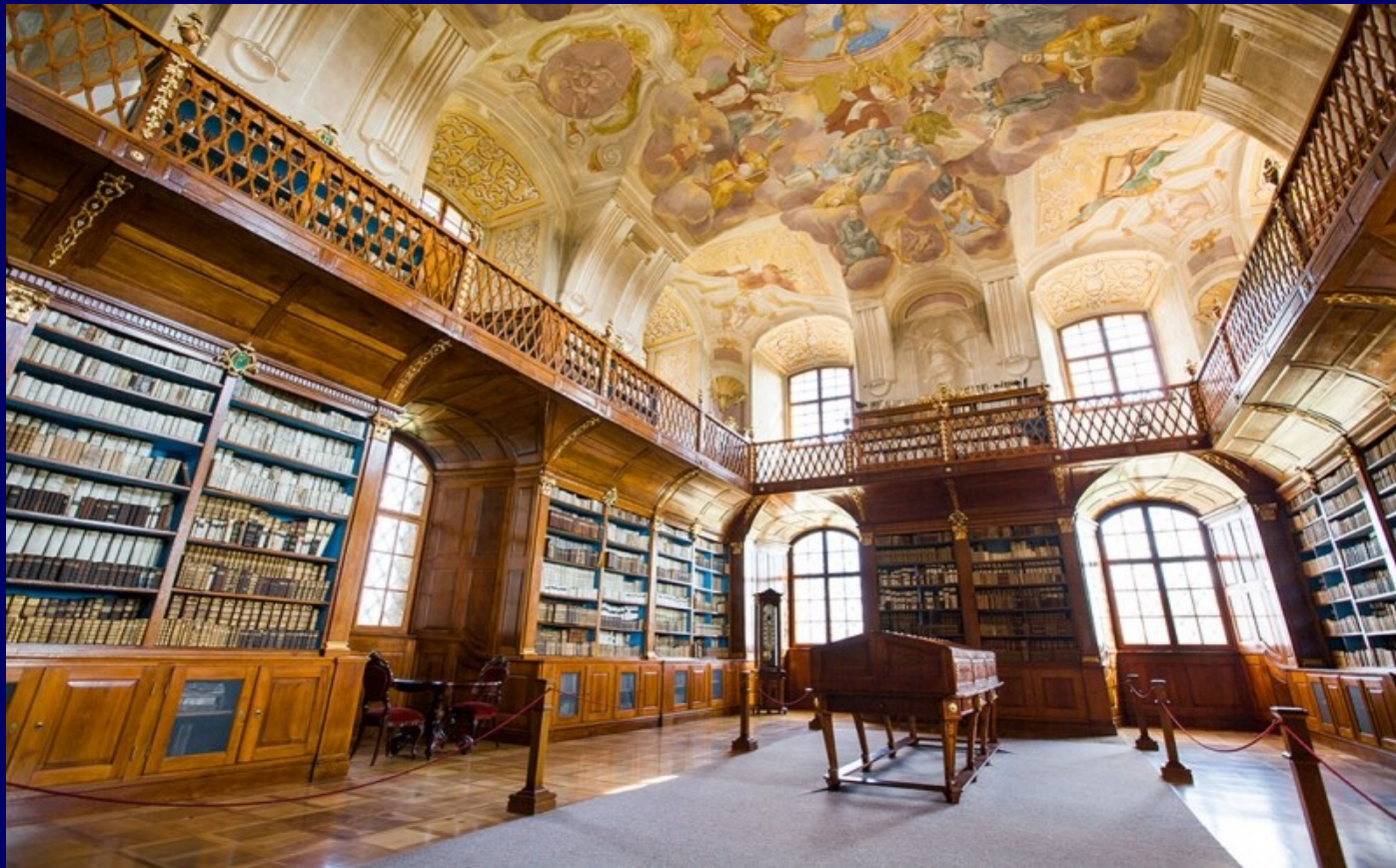
12. Biblioteka Opactwa Benedyktynów Rajhrad