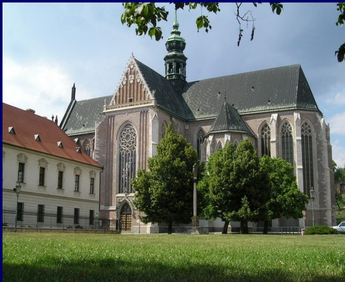
6. Bazylika Wniebowzięcia Marii Panny w Brnie (fundacja 1323 r., Elżbieta Ryksa)