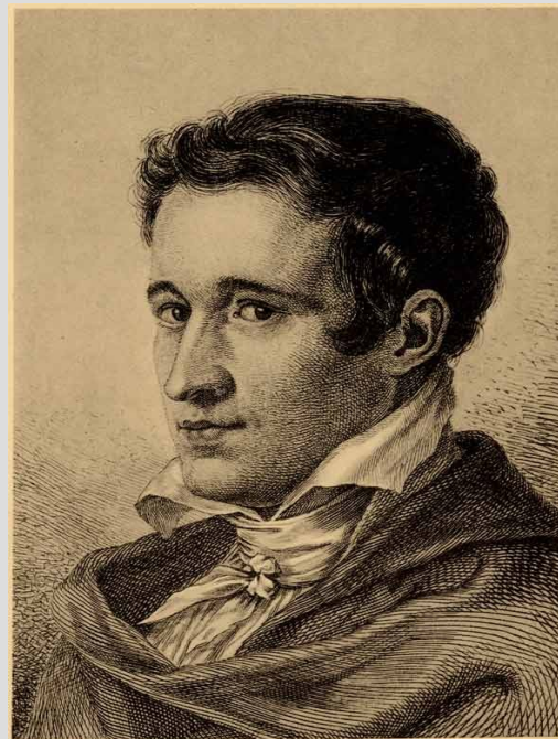
93. Jacob Grimm