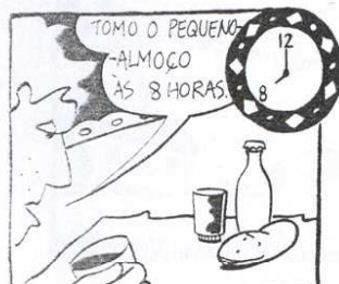
Ele toma o pequeno-almoço às 8h.