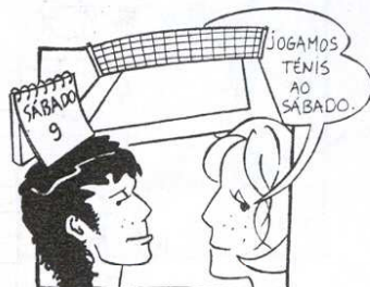
Eles jogam ténis ao sábado.