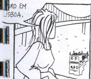
Ele mora em Lisboa.