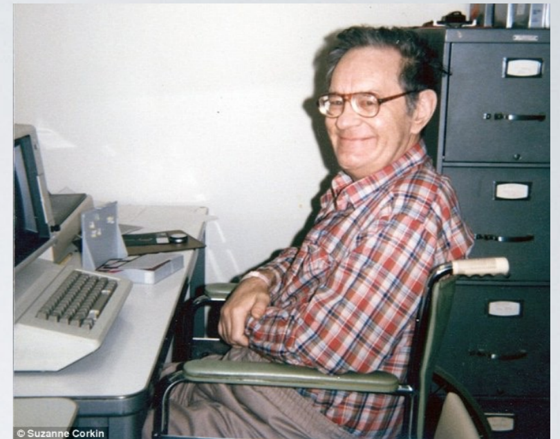
Henry Molaison (1926 - 2008)