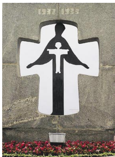
Památník obětem hladomoru na Ukrajině v letech 1932–1933, který se nachází v Kyjevě

Když kolchozy nedokázaly plnit předepsané dodávky obilí státu, poslal Stalin do vesnic vojsko a policii. Při rekvizicích zabíraly nejen úrodu,