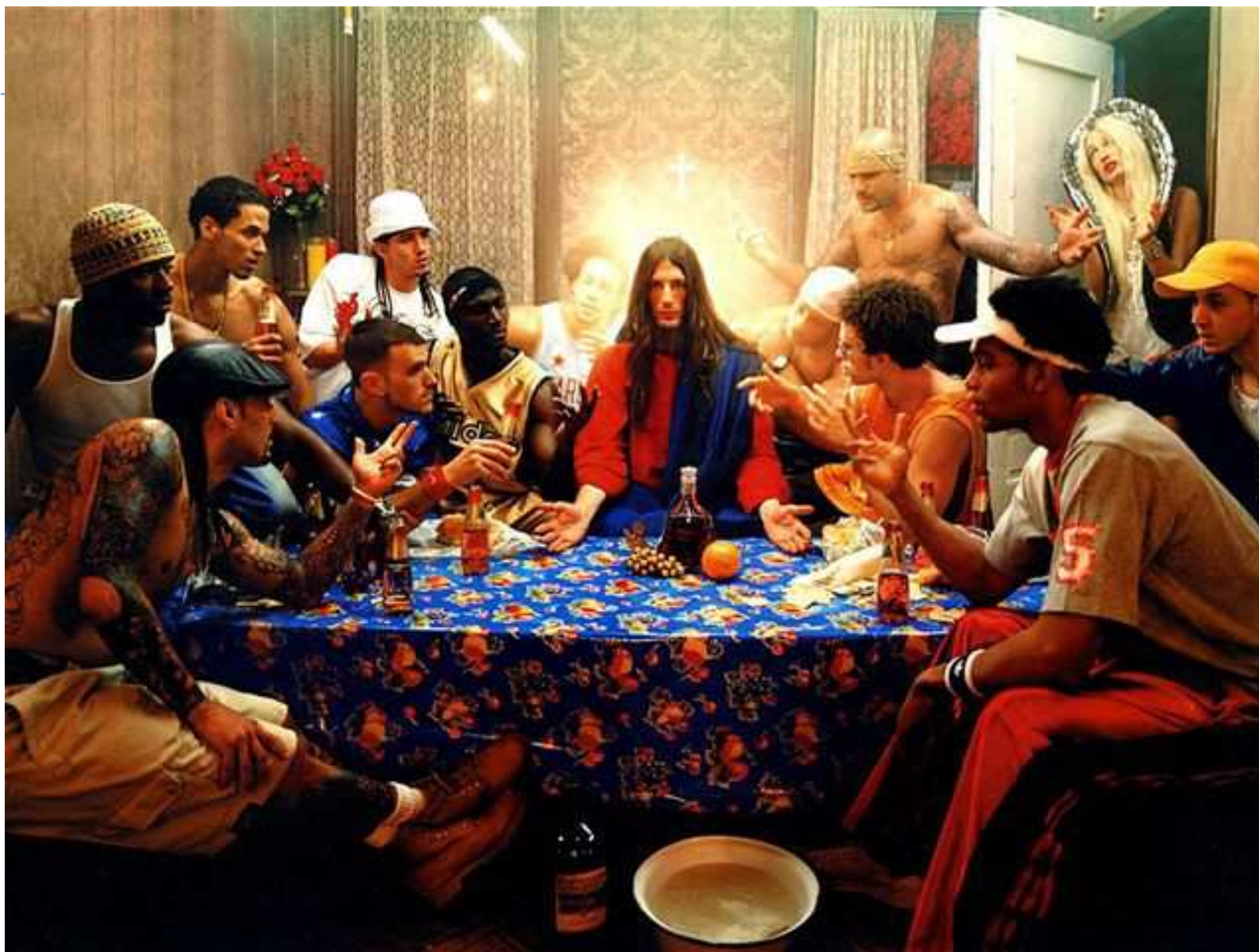
David LaChapelle: Poslední večeře, 2003