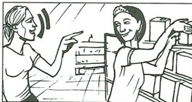
e) fragen: eine Frau / ein Verkäufer / ?