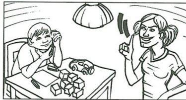
b) antworten: ein Arzt / eine Nachbarin / ?