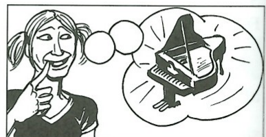
f) möchte: ein Haus / ein Hund / ?

Vzor: danken: ein Mädchen / eine Buchhalterin / ? - A: Ulrike dankt einem Mädchen. B: Aber nein, Ulrike dankt einer Buchhalterin. C: Ich meine (Domnívám se), sie dankt einem Buchhalter.