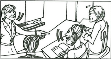
d) etwas sagen: ein Mädchen / eine Verkäuferin / ?