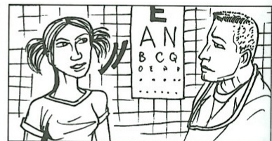
c) bitten: eine Lehrerin / ein Kind / ?