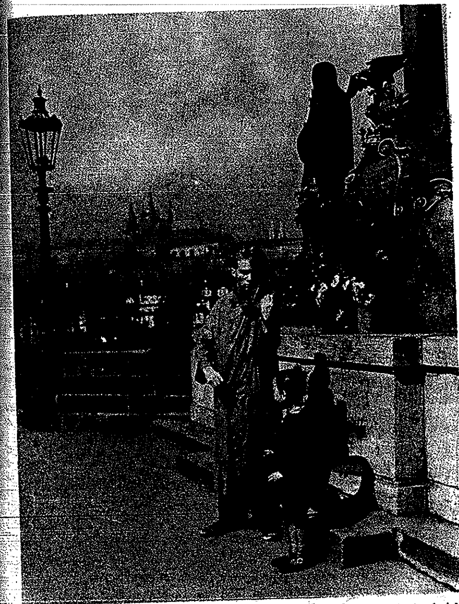
Alegorický záběr z filmu Humoreska (1939) využívající panorámu Pražského hradu jako tradičního symbolu českého státu

Upřímný zájem, který projevovali filmaři i diváci o adaptaci literární klasiky, signalizoval zvroucnělý vztah k národnímu kulturnímu dědictví. Filmovou podobu dostala díla Boženy Němcové, J. K. Tyla, K. V. Raise, Vítězslava Háška, Jákuba Arbesa, Viléma Mrštíka, J. Š. Baara, Karla Klöstermanna, K. M. Čapka Choda, F. X. Svobody, M. A. Šimáčka, tedy vesměs literatura 19. a počátku 20. století. Některé z těchto adaptací bezpochyby vznikly dříve pro zvukové jméno klasikovo než pro dispozici díla k filmovému zpracování či aktuálnost jeho obsahu. Filmová kritika dospěla k takovému zjištění například nad adaptací Paličova