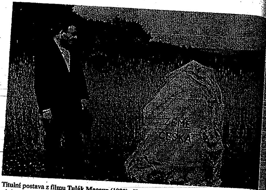
Titulní postava z filmu Tulák Macoun (1939) při přechodu česko-německé hranice. Hudební doprovod tohoto záběru tvoří citace státní hymny Kde domov můj

Krška, 1939; premiéra 20.10. 1939) zahleděném do opojné letní přírody jižních Čech či v Babičce, jejíž exteriéry se natáčely přímo v ratibořickém údolí. Umění vyjádřit „český valeur krajinný“ ocenil A.M. Brousil na Tuláku Macounovi . 35 Filmoví tvůrci se ovšem nespolehali jen na estetickou „soběstačnost“ české krajiny; hleděli tuto krajinu jako malebnou definovat, a to s použitím různých prostředků, jež nabízí filmový jazyk. Na jímavou krásu české země často upozorňovali prostřednictvím některé z postav, jež se v náhlém okouzlení zahledí do líbezného kraje. Poté dostane i divák příležitost spatřit zdroj tohoto okouzlení ( Tulák Macoun , Babička , Barbora Hlavsová , Humoreska ad.). Ke konvencím filmového jazyka této doby (z hlediska filmové hudby to byla éra symfonismu) také patřilo, že panoramatické záběry krajiny doprovázela silně emotivní, zpěvně rozklenuté symfonická hudební plocha vyrůstající zpravidla z novoromantického nebo pozdně romantického slohu. Měla v divácích vyvolávat tytéž emoce, jaké při pohledu do kraje pociťovaly filmové postavy. V podrobněji citované scéně v Tuláku Macounovi k tomu skladatel Josef Dobeš užil snadno identifikovatelných a spolehlivě rezonujících hudebních citací. V Babičce se zase skladatel Jiří Fiala ve srovnatelné