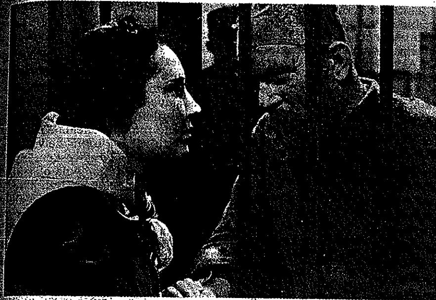
Jedna ze scén vnašejších do adaptace klasické divadelní hry J. K. Tyla Paličova dcera (1941) aktuálně znějící motiv nesvobody.

klamativně předčítat: „Dávno, dávno již tomu, co jsem posledně se dívala do té milé, mírné tváře...“ Čáp tak hned v prvním záběru definoval svou adaptaci jako filmem ilustrovanou četbu důvěrně známého, milovaného románu. I literární původ syžetu se tedy stal – a ne náhodou – součástí filmového vyprávění.