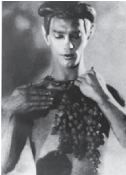
Ruský tanečník Vaclav Nižinskij vystupoval v r. 1909 v Paříži spolu s Ruským baletem.

říži daří mnohem více než v kterémkoliv jiném městě na světě; každé páté kino je označeno jako „umělecké a experimentální“. Jsou tu i velké multiplexové řetězce jako Gaumont a MK2, které ohrožují majitele nezávislých kin, distributory a vystavovatele (i když vedle komerčních titulů uvádějí i umělecké filmy).