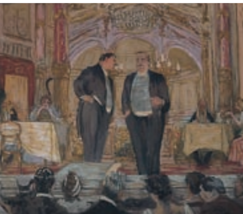
Théâtre des Champs-Élysées navrhl Auguste Perret v letech 1911–1913.

Paříží podporovaný Théâtre de la Ville se specializuje na uvádění součas-