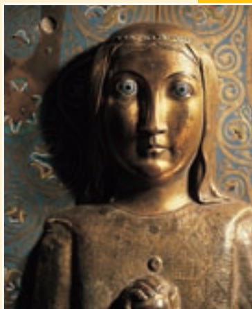
Detail sochy, bazilika sv. Denise

Paříž dnes 10–15 Dějiny Paříže 16–31 Umění 32–34