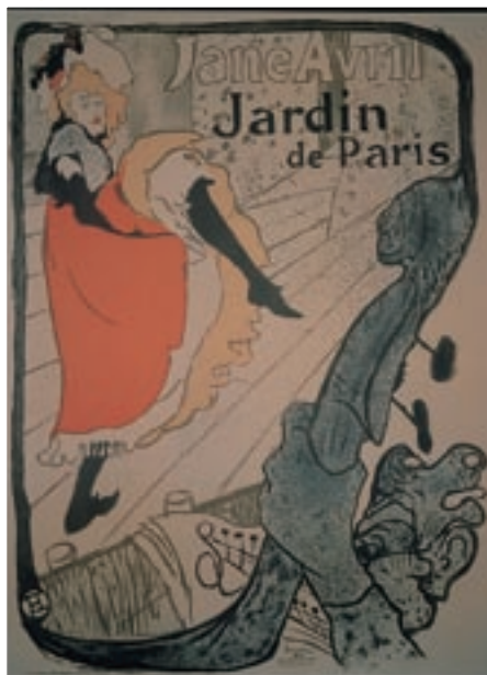
Plakát propagující noční život v devadesátých letech, autor Toulouse-Lautrec

Íle de France je kolébkou gotické architektury. V r. 1136 byly položeny základy baziliky