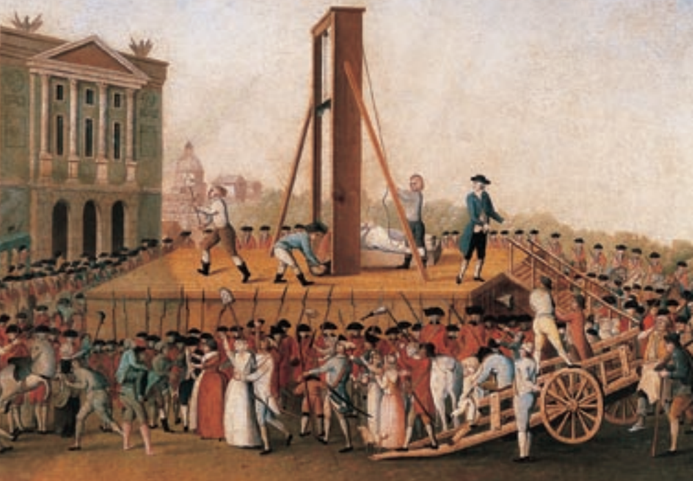
„Poprava Marie Antoinetty 16. října 1793“. Musée Carnavalet, Paříž. Královna byla sfata na Place de la Révolution, dnes Place de la Concorde.

Paříží. Ludvík XVI. se uchýlil do Hôtel de Ville, kde přijal kokardu od nové vlády.