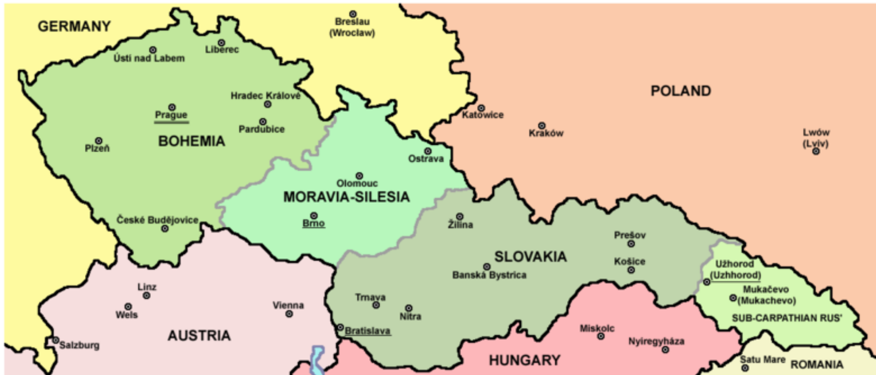
●●●● - Czechoslovakia in 1928-1938