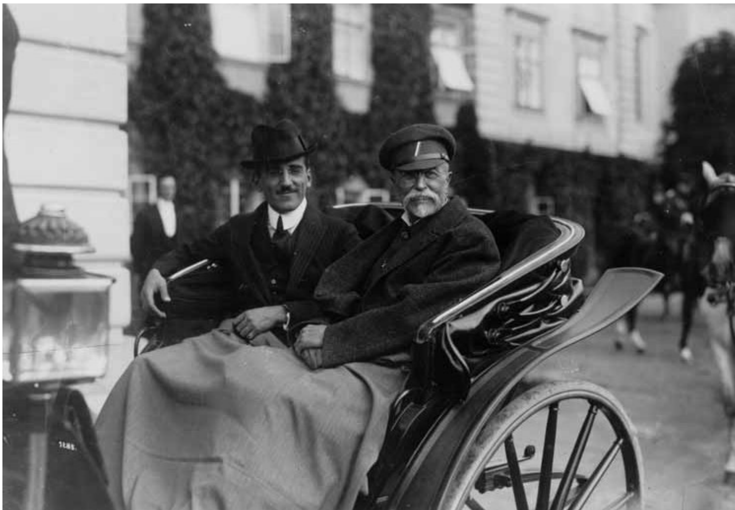
Král Alexandr na návštěvě u prezidenta Masaryka v Lánech v roce 1922.