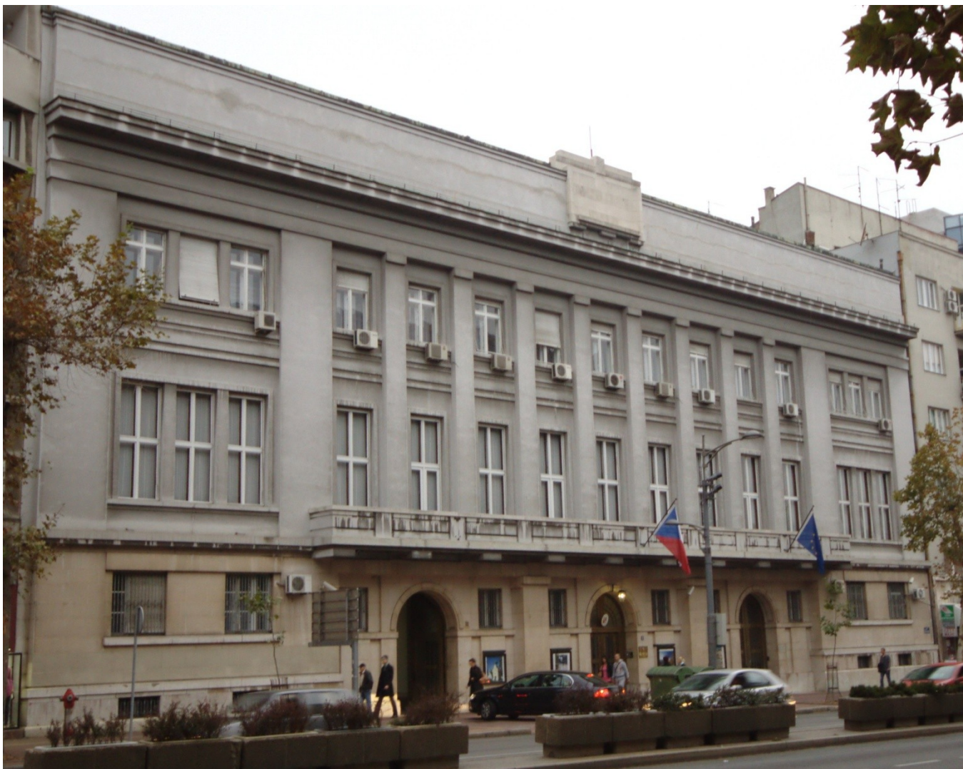
Budova československého vyslanectví v Bělehradě na Bulvaru Kralja Aleksandra postavená v letech 1925–1929 (dnešní stav)