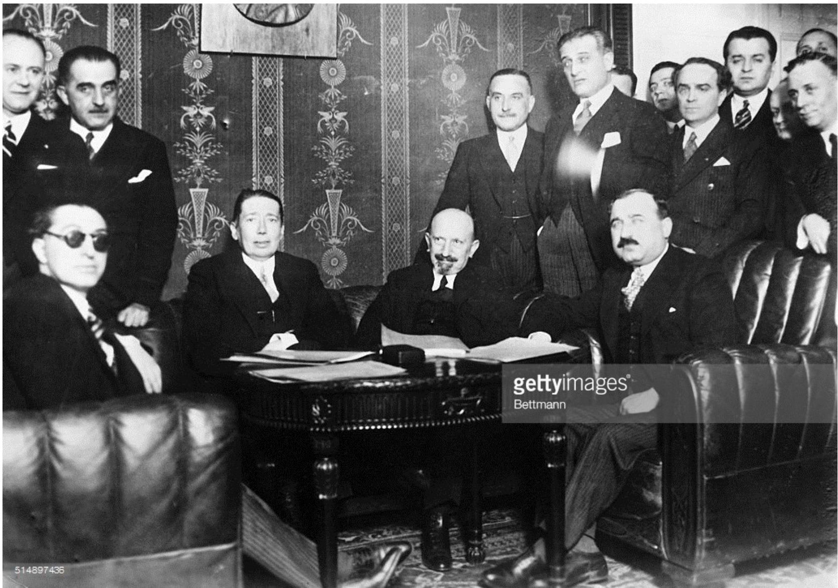
Podpis Balkánského paktu v Bělehradě – ministři zahraničních věcí Turecka, Rumunska, Řecka a Jugoslávie