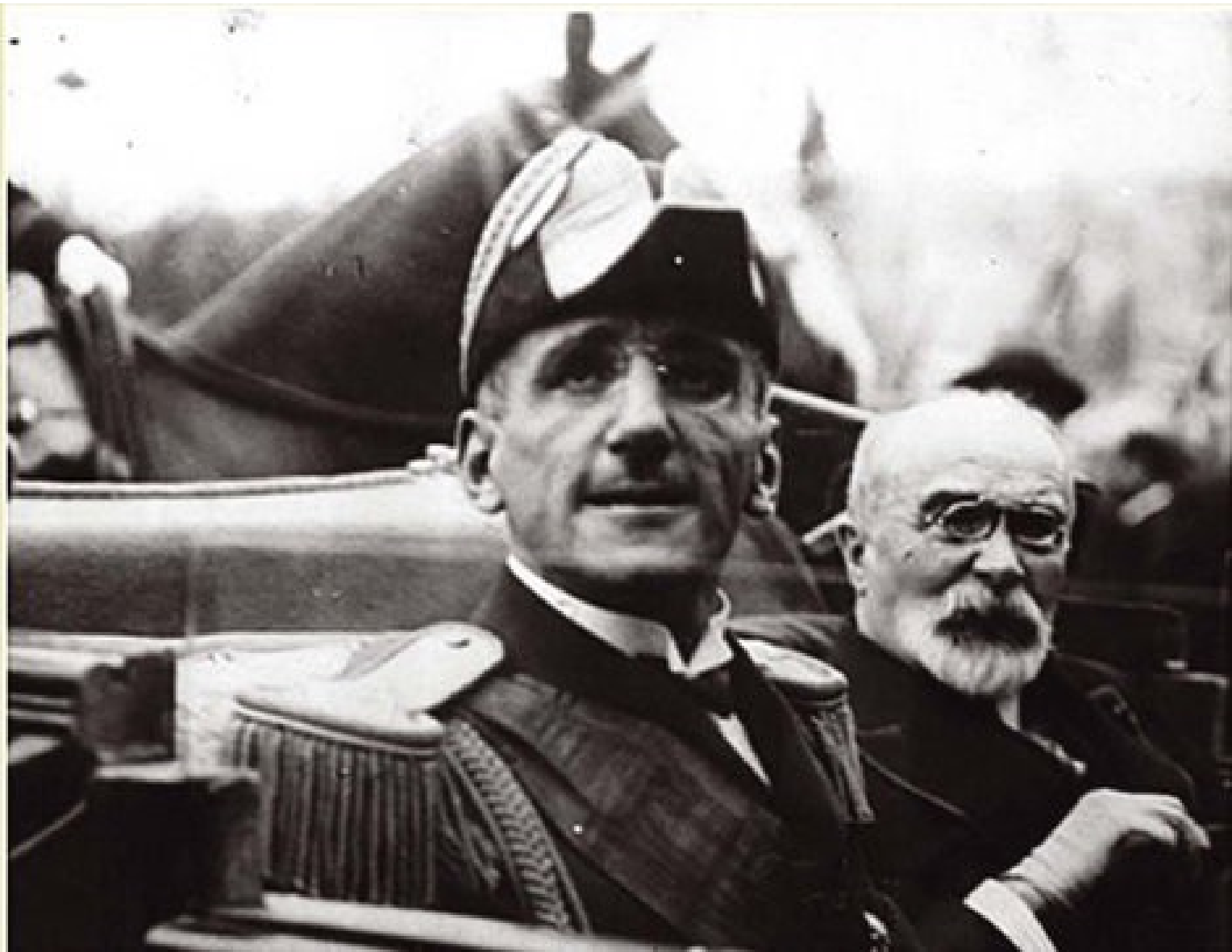
Král Alexandr a Louis Barthou v Marseille 9. října 1934