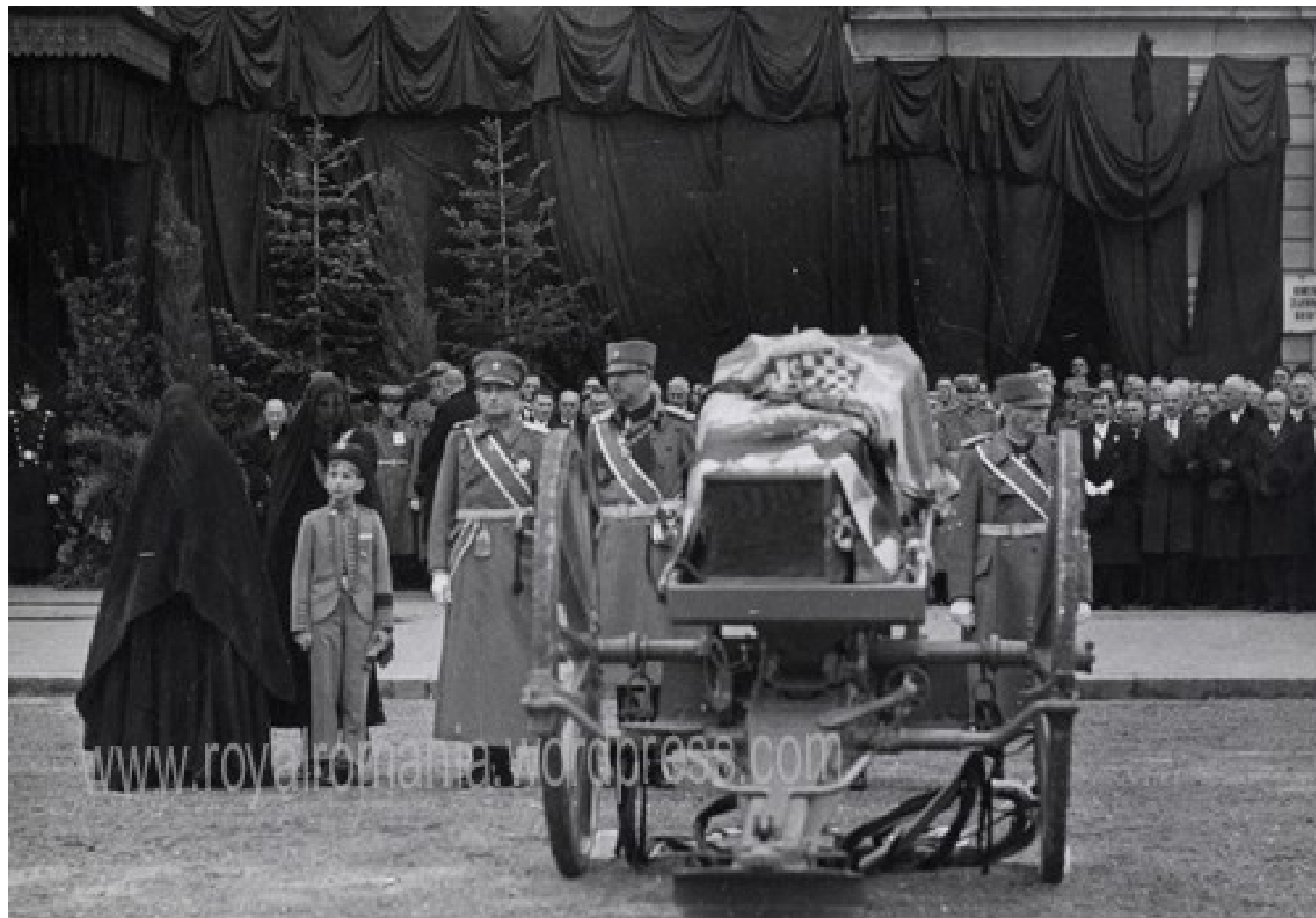
Pohřeb krále Alexandra – u rakve královna Marie, následník trůnu Petr II. a princ regent Pavle