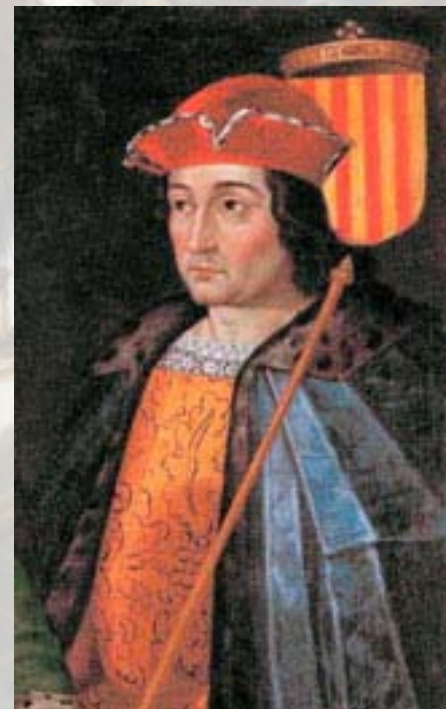
Ramon Berenguer IV.

Nezávislý muslimský stát s centrem v dnešní Tortose. V roce 1110 padl do rukou Almorávidů, v roce 1148 dobyt Ramonem Berenguerem IV.