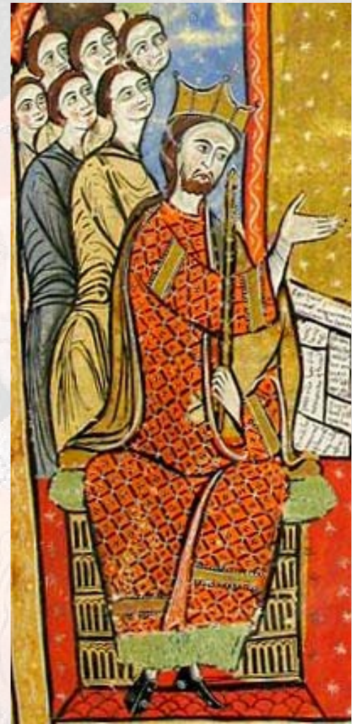
Liber feudorum maior