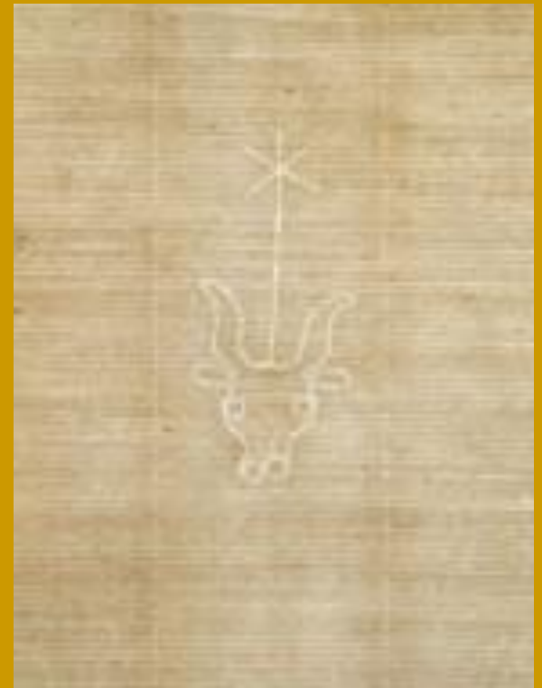
papír s filigránem z Caselle, severní Itálie, ca. 1455