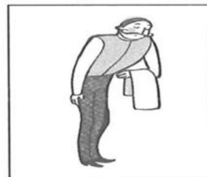
11. _____ er