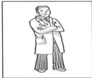
3. _____ arz