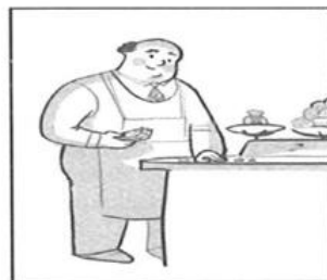
7. _____ ca