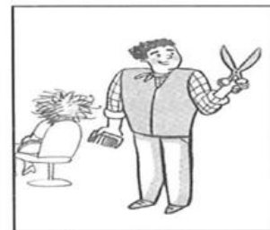
12. _____ er