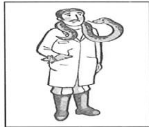
4. _____ arz