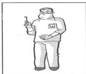
5. _____ ysta