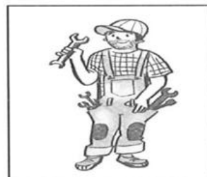
10. _____ ik