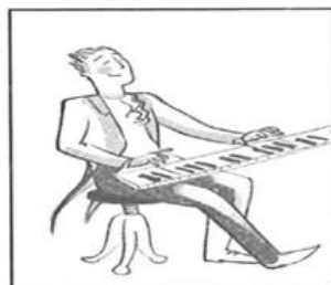
6. _____ ista