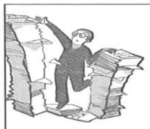
9. _____ ik