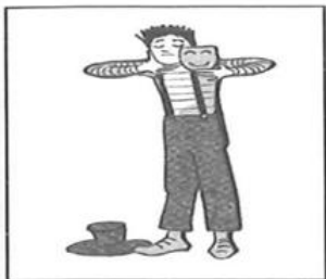
1. _____ akt or

fryzj- lek- kierow- kondukt- mechan- weteryn- urzędn- keln- pian- dent- akt- sprzedaw-