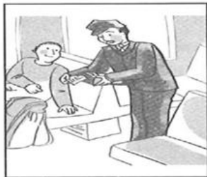
2. _____ or