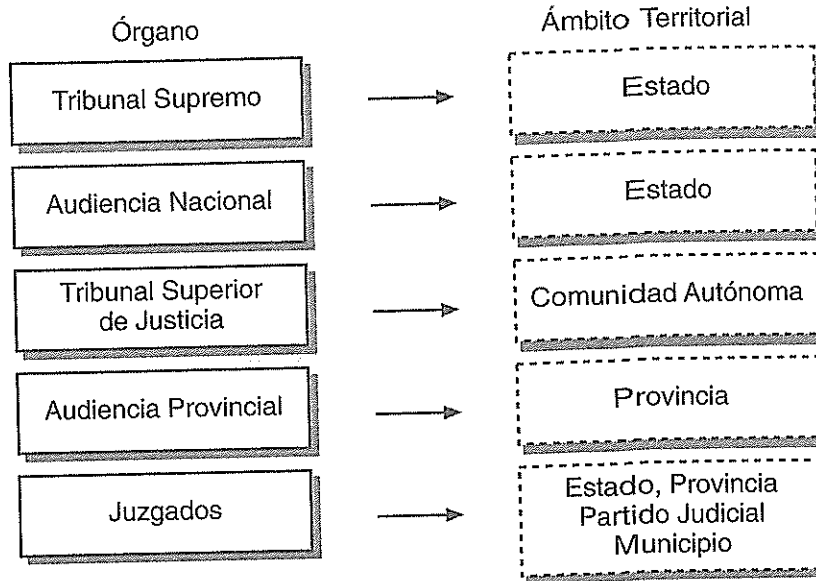
Ámbito territorial de los órganos judiciales (jurisdicción ordinaria).