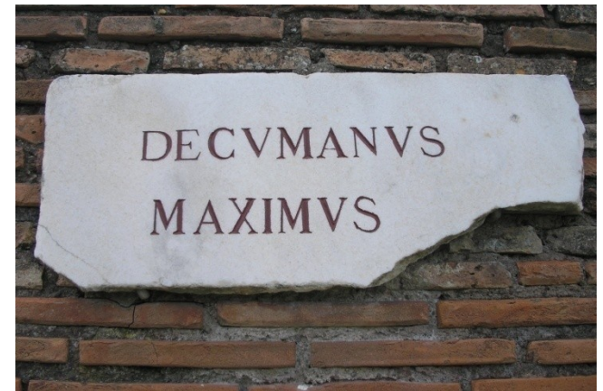
Cardo x decumanus