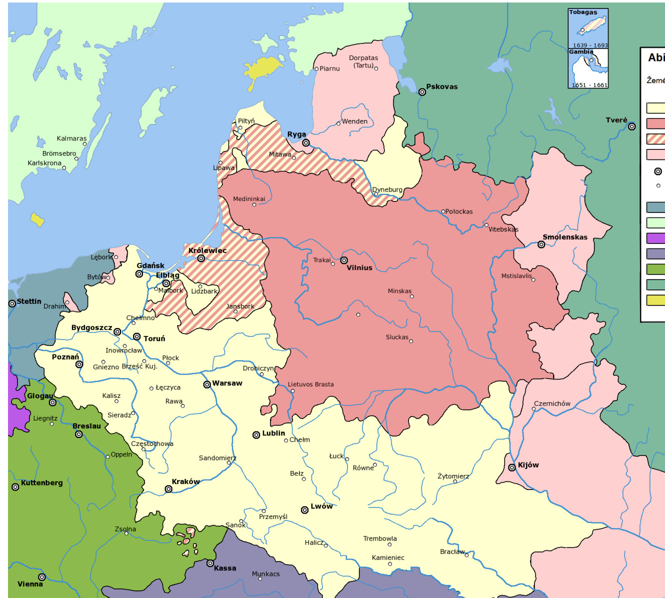
Tobago 1639 - 1693 Gambia 1651 - 1661