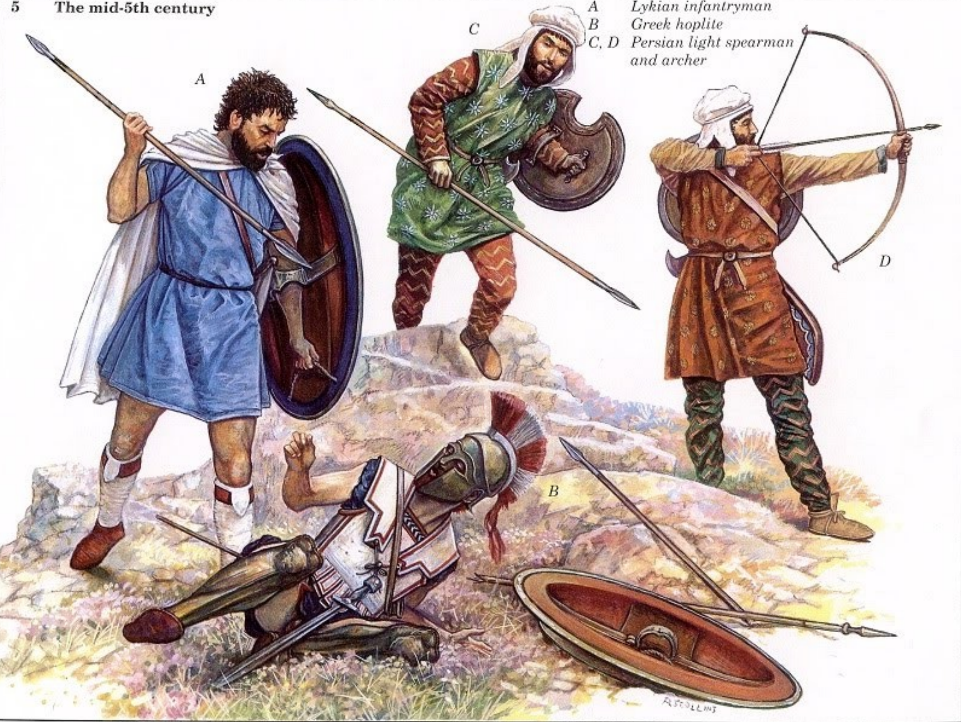
A Lykian infantryman B Greek hoplite C, D Persian light spearman and archer