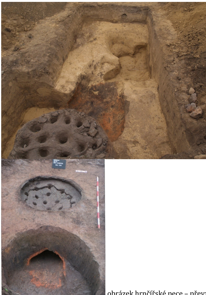
obrázek hrnčářské pece

Pece na pálení vápna se nacházejí na několika sídlištích starší doby římské. Jedná se o jednoduché zahloubené pece (Droberjar 2002, 235). Hrnčářské pece byly situovány v blízkosti vodních toků, kde byla kvalitní půda, v údolích, kde využívali příznivý vítr. Zajímavá je poloha na sídlišti v blízkosti hliníku, z kterého brali půdu (Filipová 2010, 65).