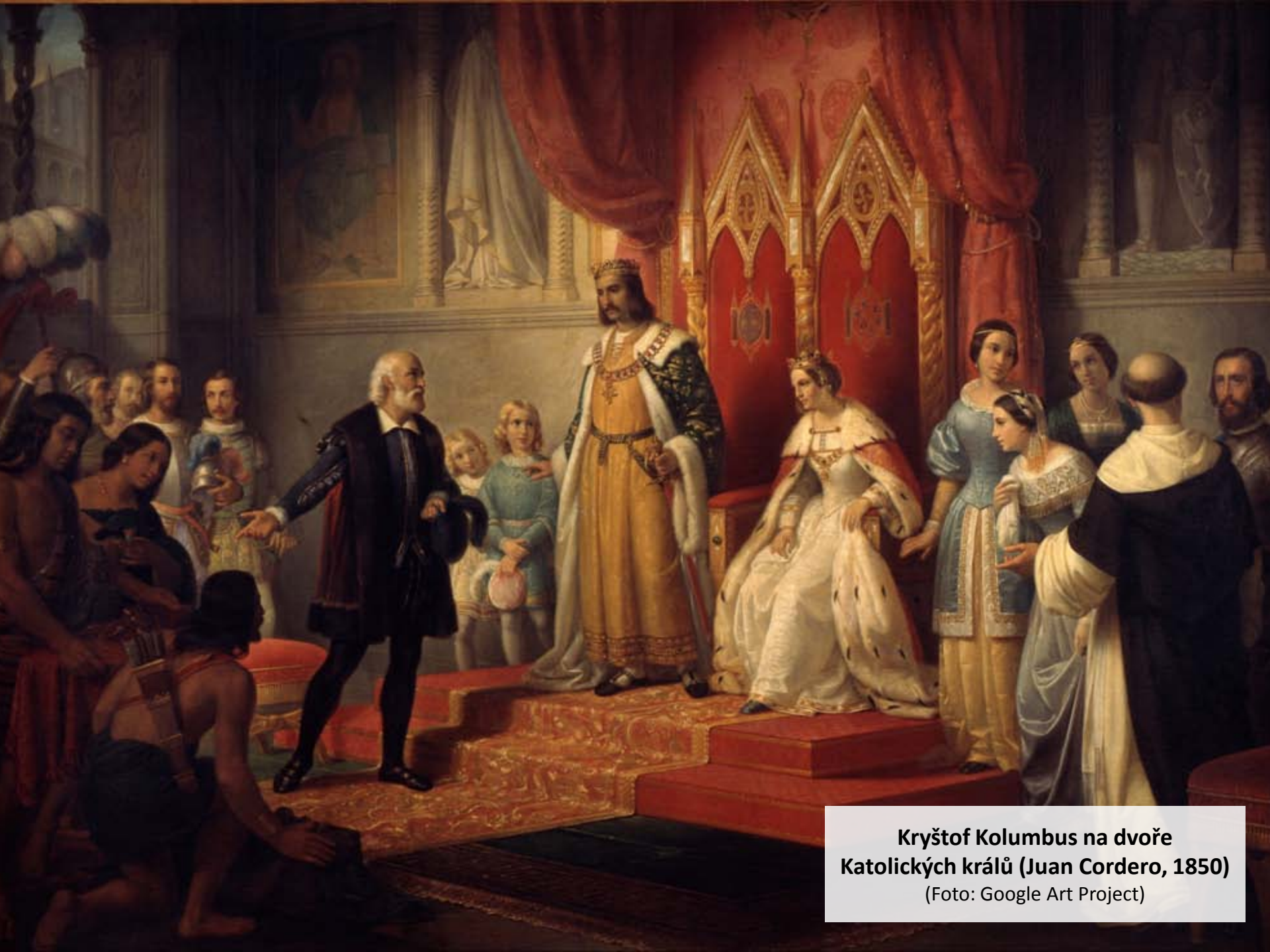
Kryštof Kolumbus na dvoře Katolických králů (Juan Cordero, 1850)