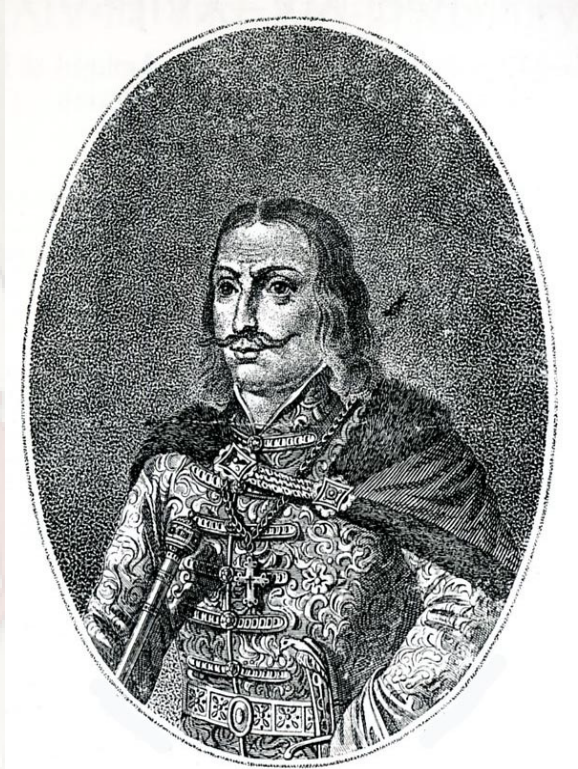
János Hunyadi (1387-1456)