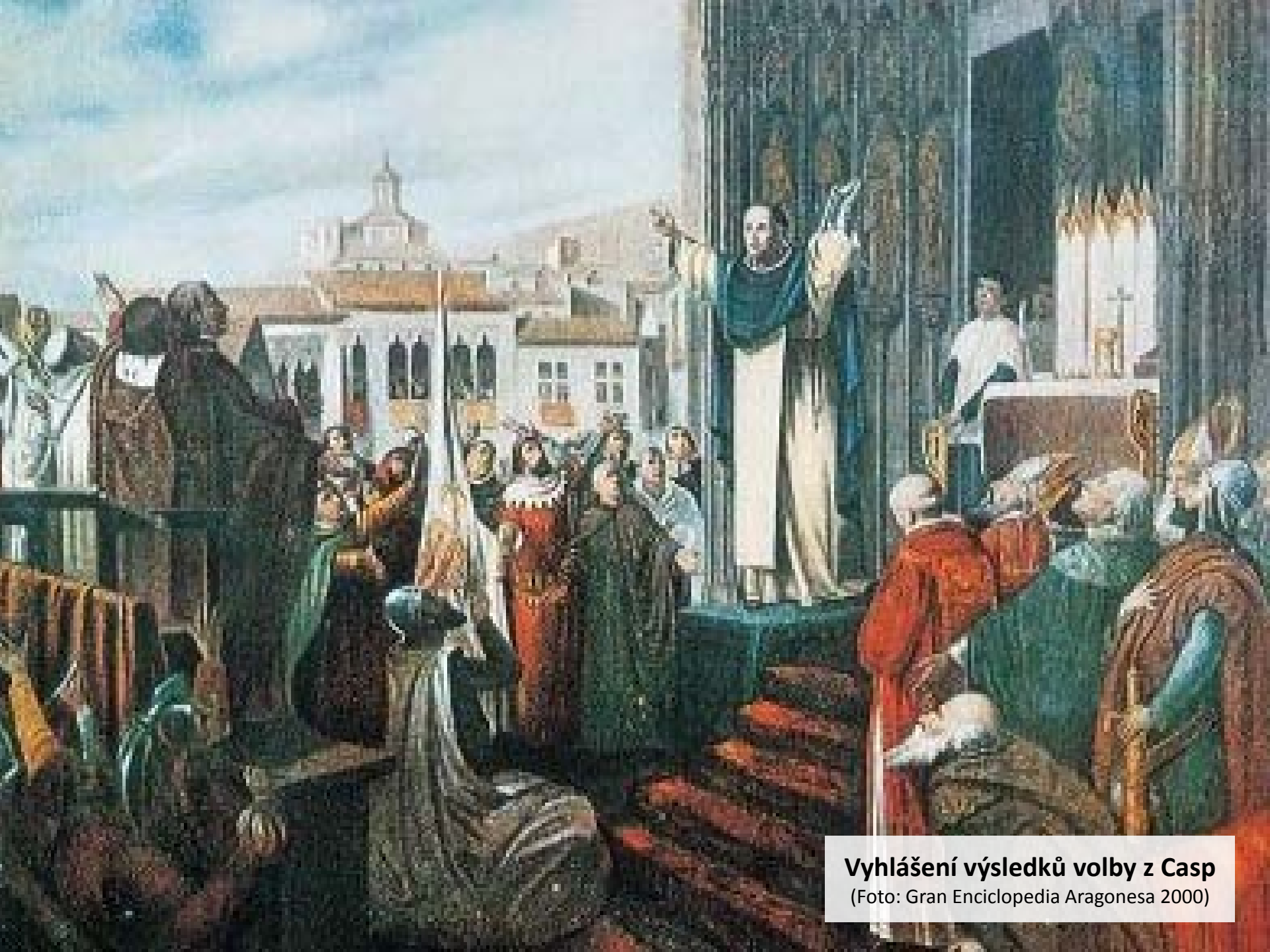
Vyhlášení výsledků volby z Casp