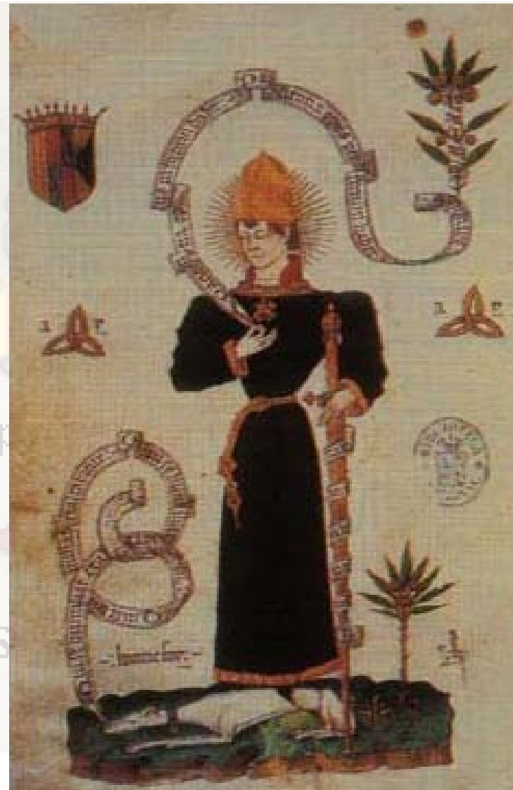
Carles de Viana

1460 se vrátil do Katalánska a Navarry, kde měl být v pozici místokrále (Katalánsko) a krále (Navarra) → opět zavřen. Propuštěn až na základě rozhodnutí katalánských Corts → slavnostně přijat v Barceloně jako místokrál (katalánské elity neměly Joana II rády).