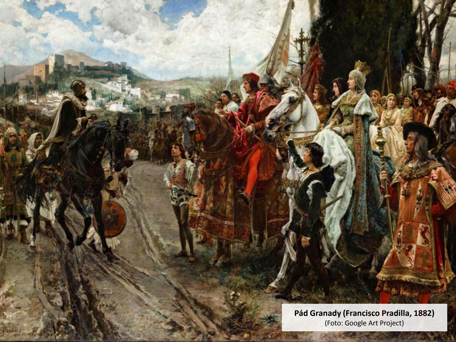
Pád Granady (Francisco Pradilla, 1882)