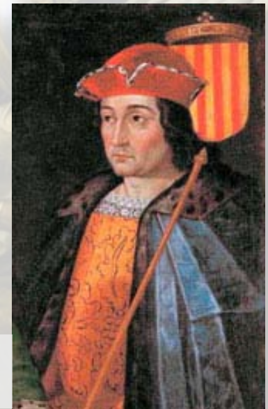
Ramon Berenguer IV.