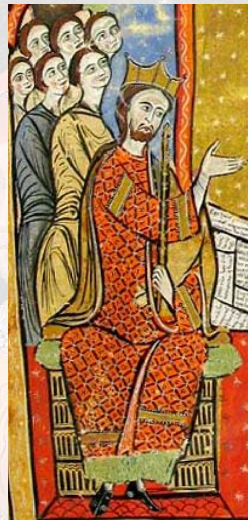
Liber feudorum maior