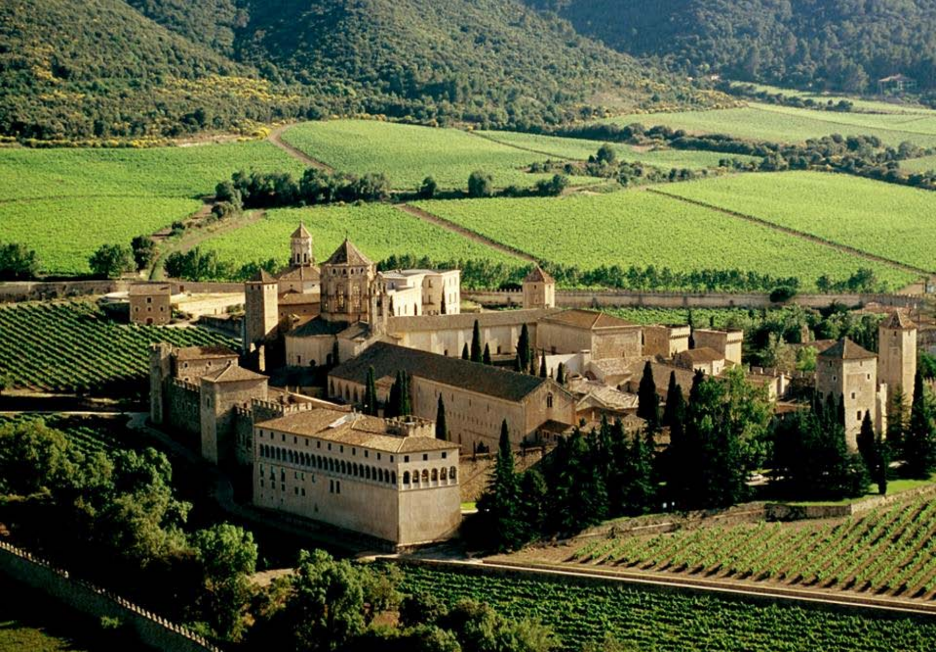
Klášter Santa Maria de Poblet