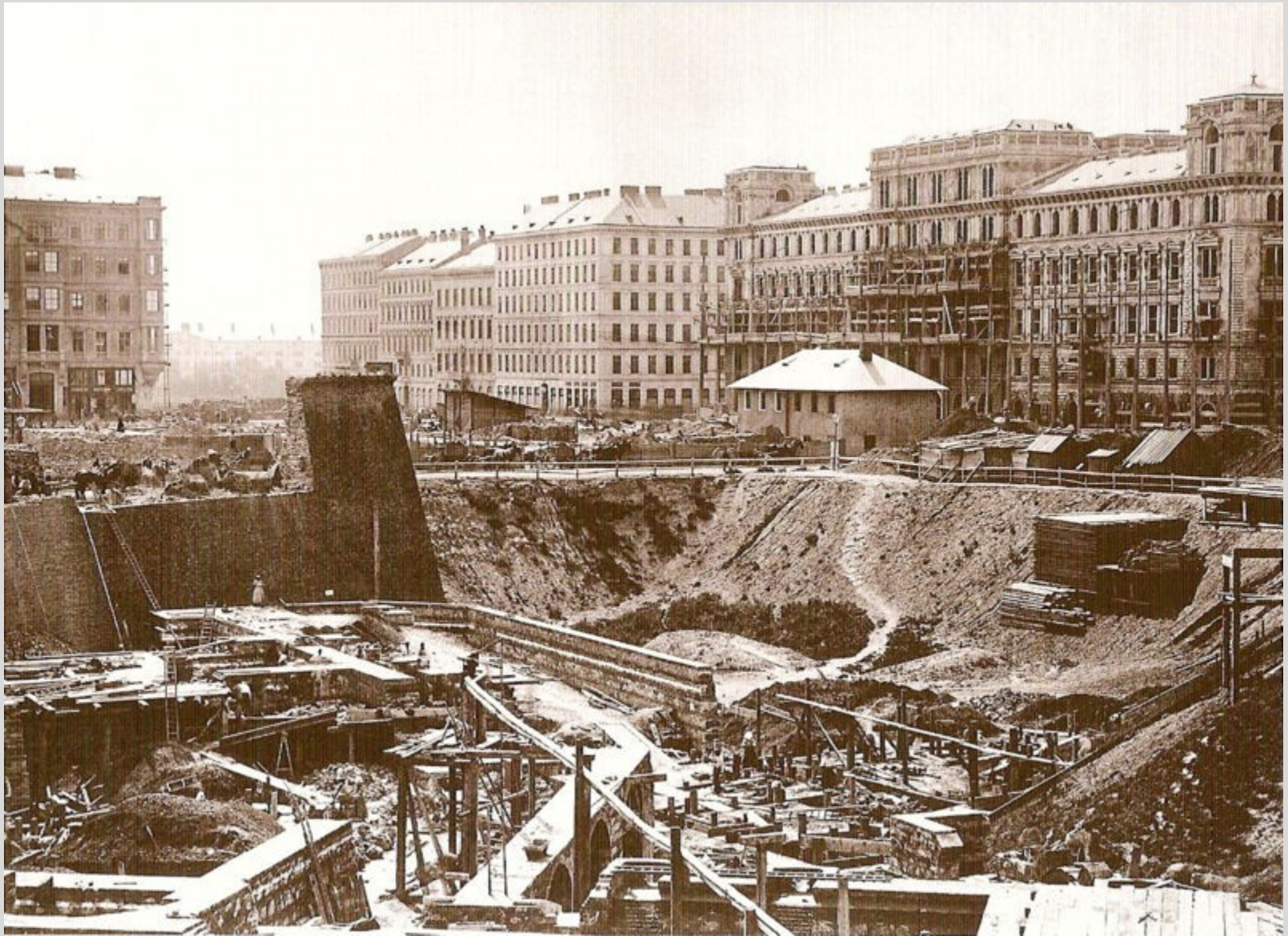
Opernhaus kurz nach Baubeginn, 1863