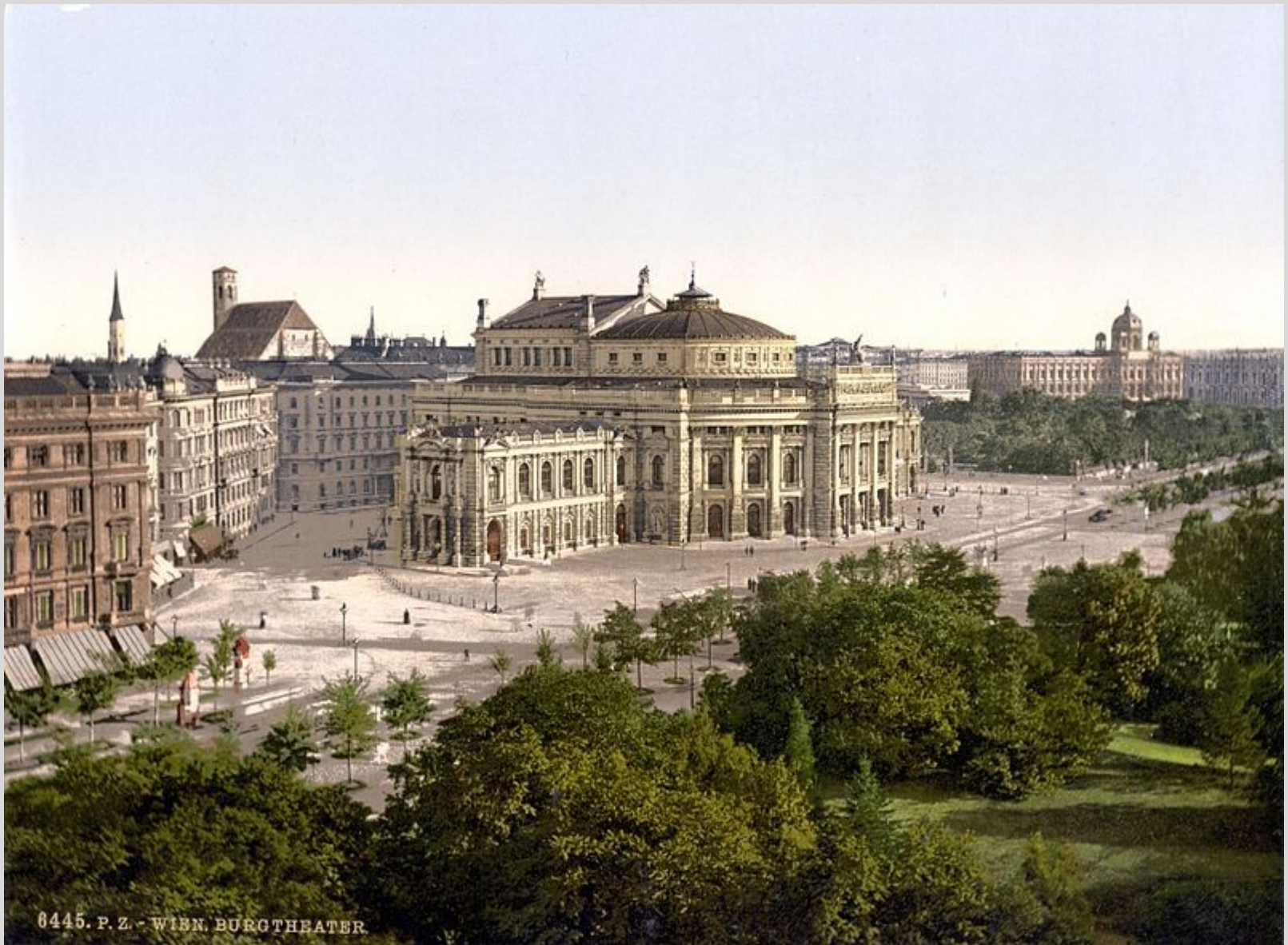
Burgtheater um 1900