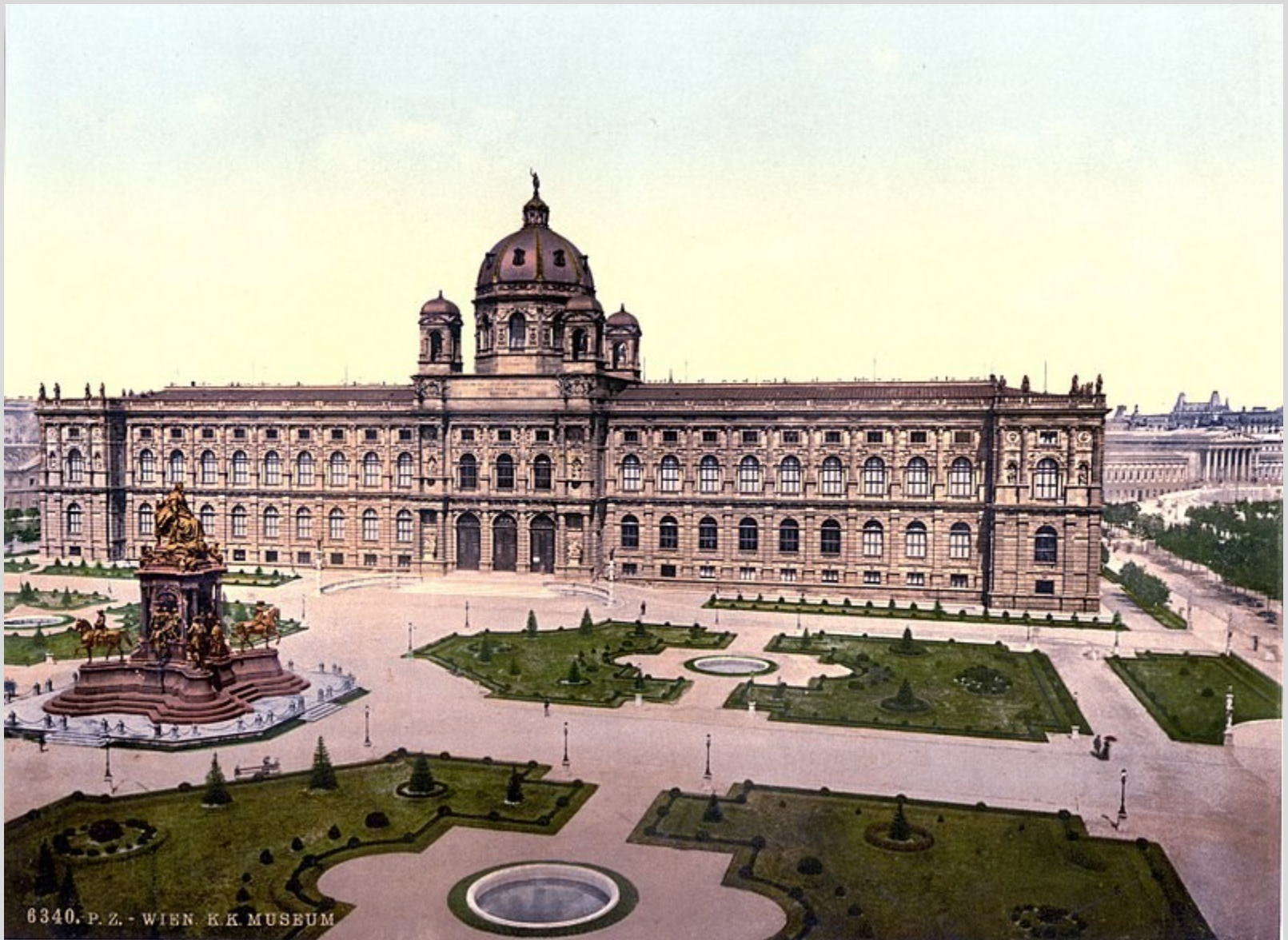
Naturhistorisches Museum um 1900