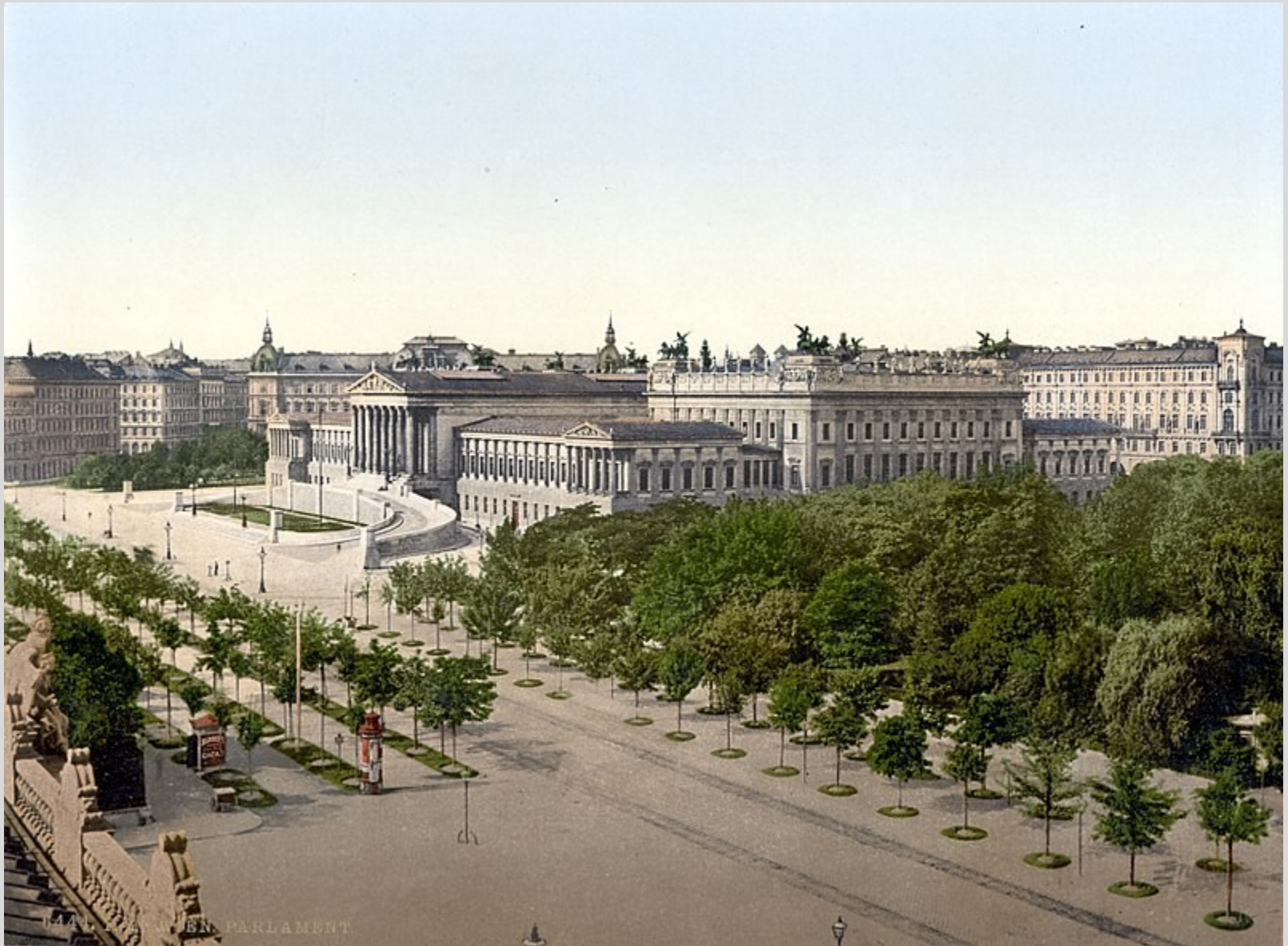
Parlament um 1900