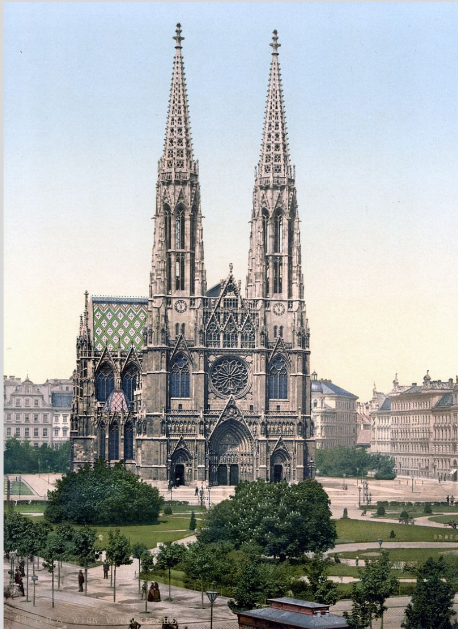
Votivkirche um 1900