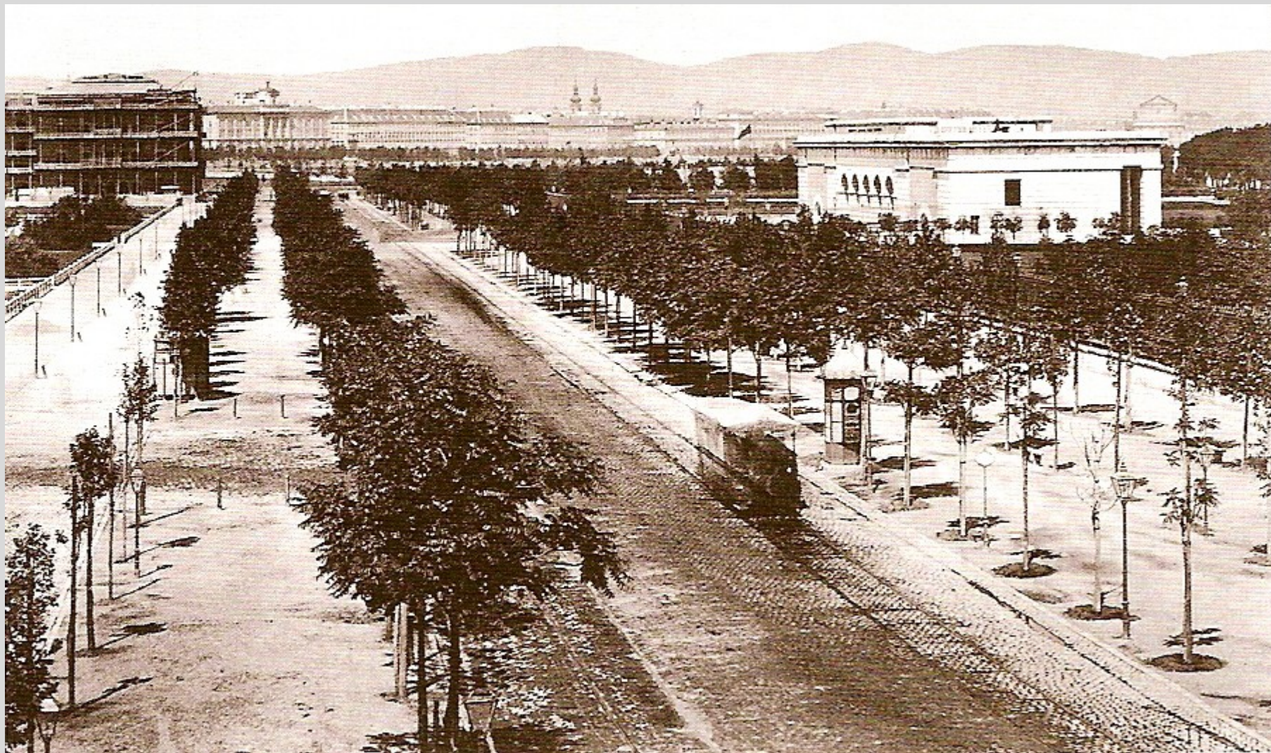
Der Burgring im Jahr 1872