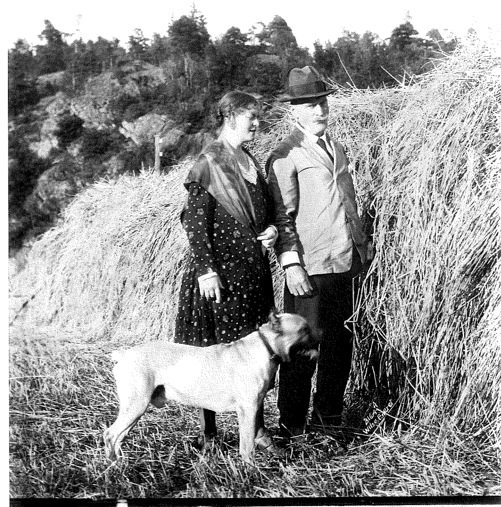
Knut Hamsun og Marie Hamsun fotografert i 1930.