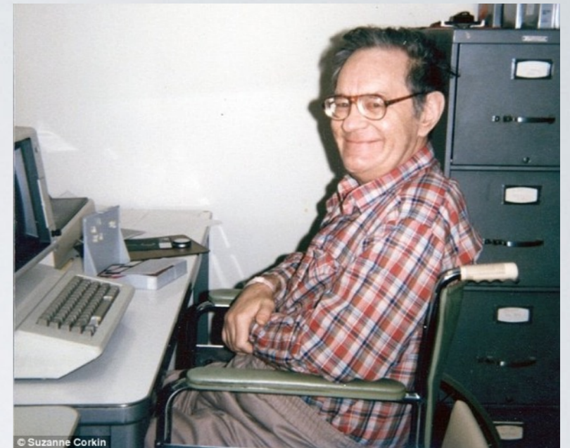
Henry Molaison (1926 - 2008)