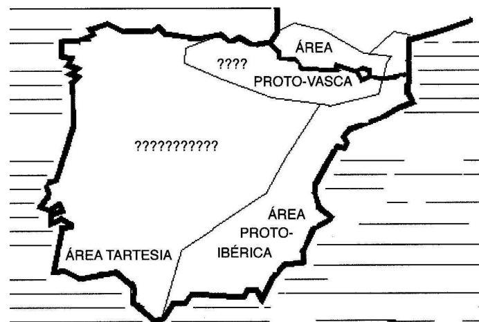
MAPA 1. Áreas de las protolenguas peninsulares.

LA GRAN IBERIA: GENES, MIGRACIONES Y COLONIAS