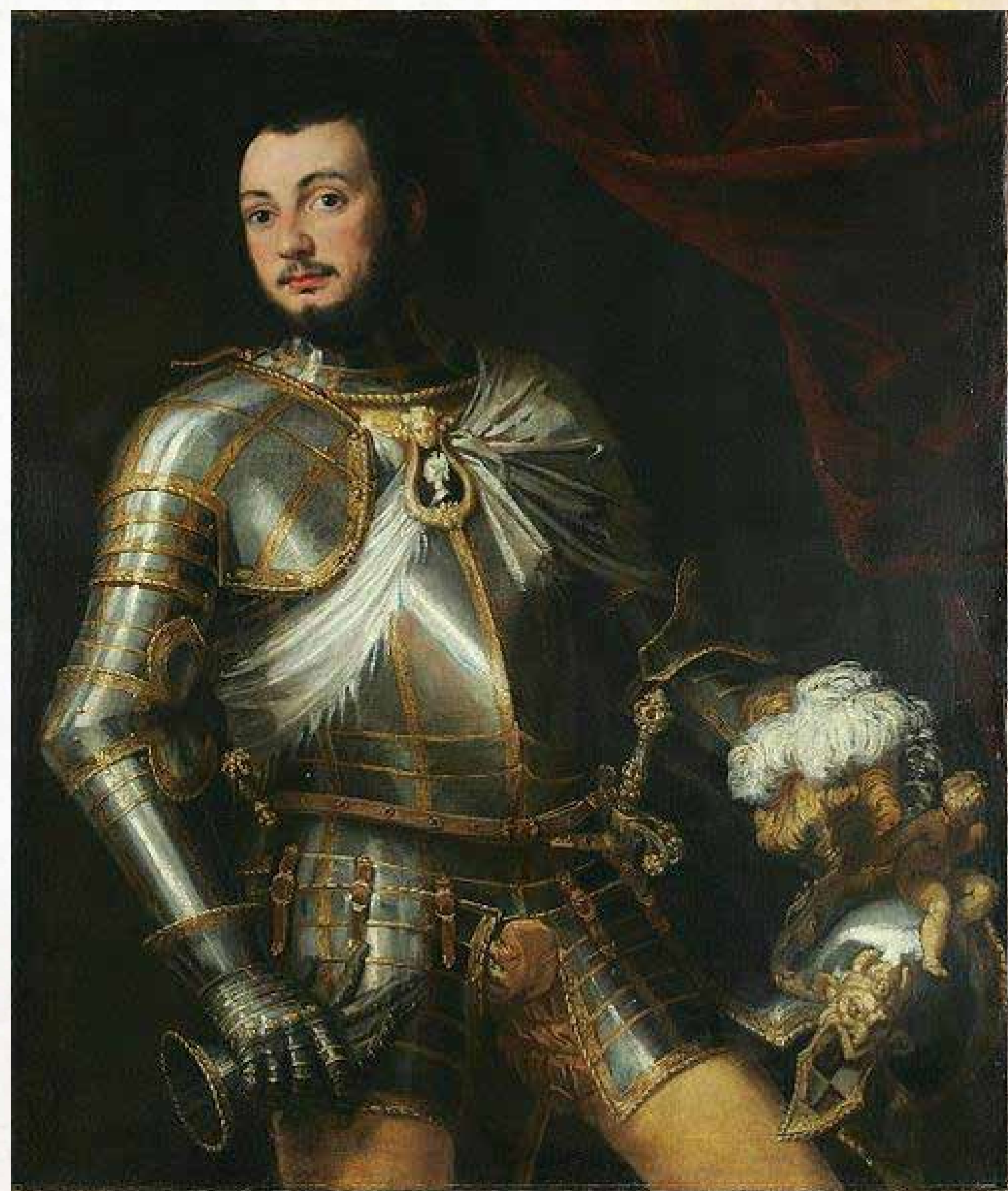
Obr. 1: Portrét Collaltina Collalta od Paola Veroneseho (1528–1588)

C ollaltino Collalto měl humanitní vzdělání a psal básně, které byly několikrát vydány. Za svou životní dráhu si přesto zvolil armádu. Jako mladík sloužil ve vojsku francouzského krále Františka I. V roce 1543 se vrátil do Itálie a usiloval o službu u anglického krále Jindřicha VIII., kam se vydal roku 1546. V roce 1548 se vrátil do Benátek, načež se dal do služeb francouzského krále Jindřicha II. Jako kondotier (velitel žoldnéřských vojsk) vedl mnoho vojenských tažení, při kterých dobýval nová území pro francouzskou korunu.