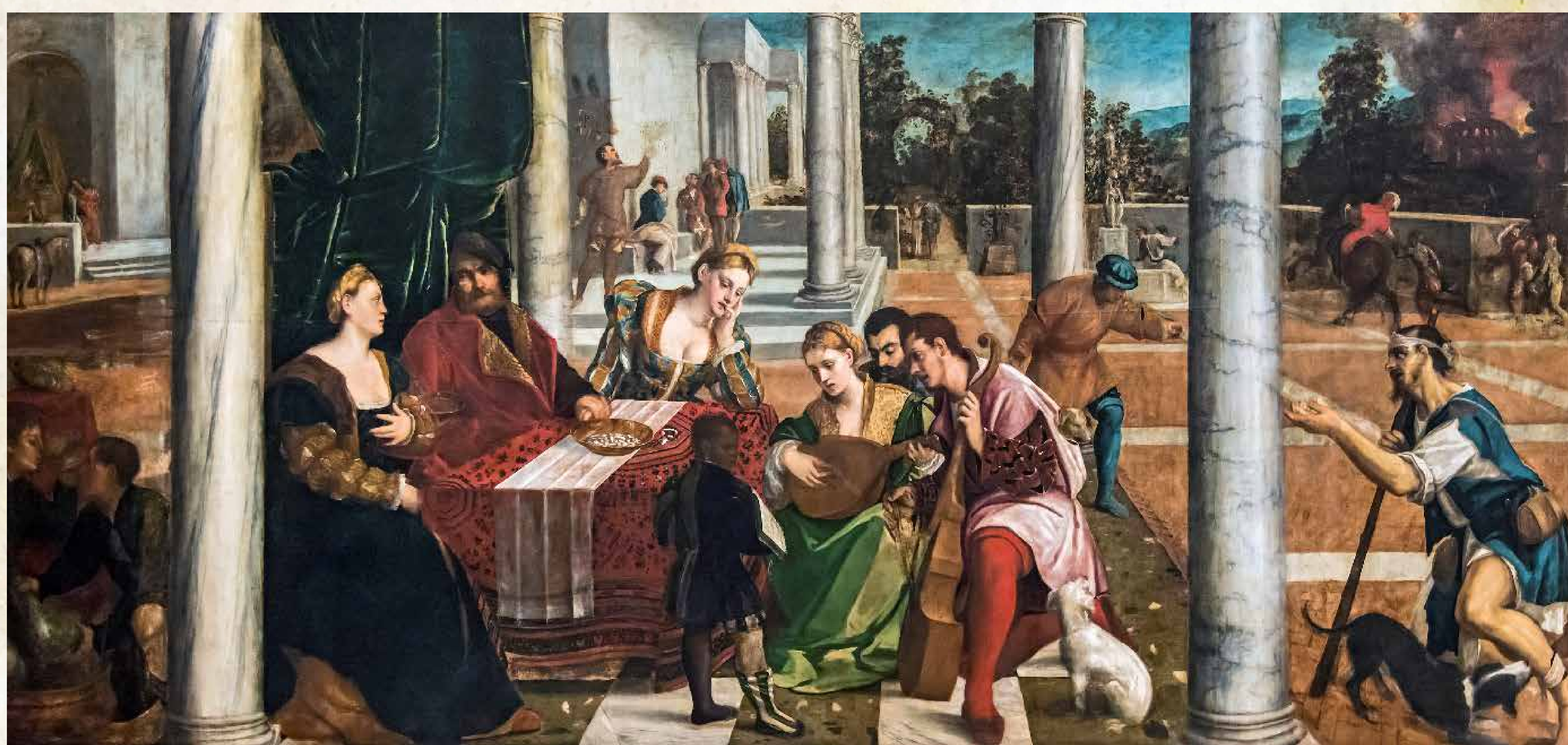
Obr. 4 – obraz „Il ricco Epulone“ od Bonifacia de Pitati (Bonifacio Veronese, 1487–1553), vyobrazená dívka s loutnou má být údajně Gaspara Stampa.

K onec života a smrt Collaltina Collalta je dodnes opředen tajemstvím. Není totiž známo kde a kdy zemřel, ani kde je pochován. Protože však svou poslední vůli nadiktoval roku 1569 v Mantově, patrně zemřel nedlouho po jejím sepsání právě v tomto lombardském městě.