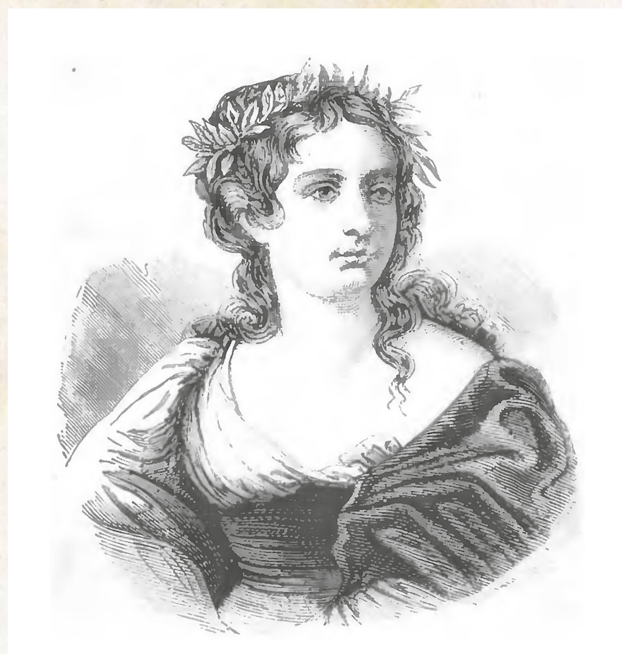
Obr. 2: Portrét Gaspary Stampy z knihy Camerini – Donne Illustri

mi verši, které doprovázela hrou na loutnu. Zde se také setkala s Collaltinem, s nímž pak pobývala na hradě San Salvatore. Jejich vztah však pro častou nepřítomnost hraběte trpěl a roku 1551 vyhasl úplně. Gaspara svůj žal poté vtiskla do svých básní, které psala až do své smrti v roce 1554. Po smrti Stampy se Collaltino v roce 1557 oženil s markýzou Giulii Torrelli, která mu porodila čtyři syny a tři dcery. Collaltino během svého dobrodružného života zplodil minimálně jednoho levobočka, na kterého pamatoval ve své závěti.