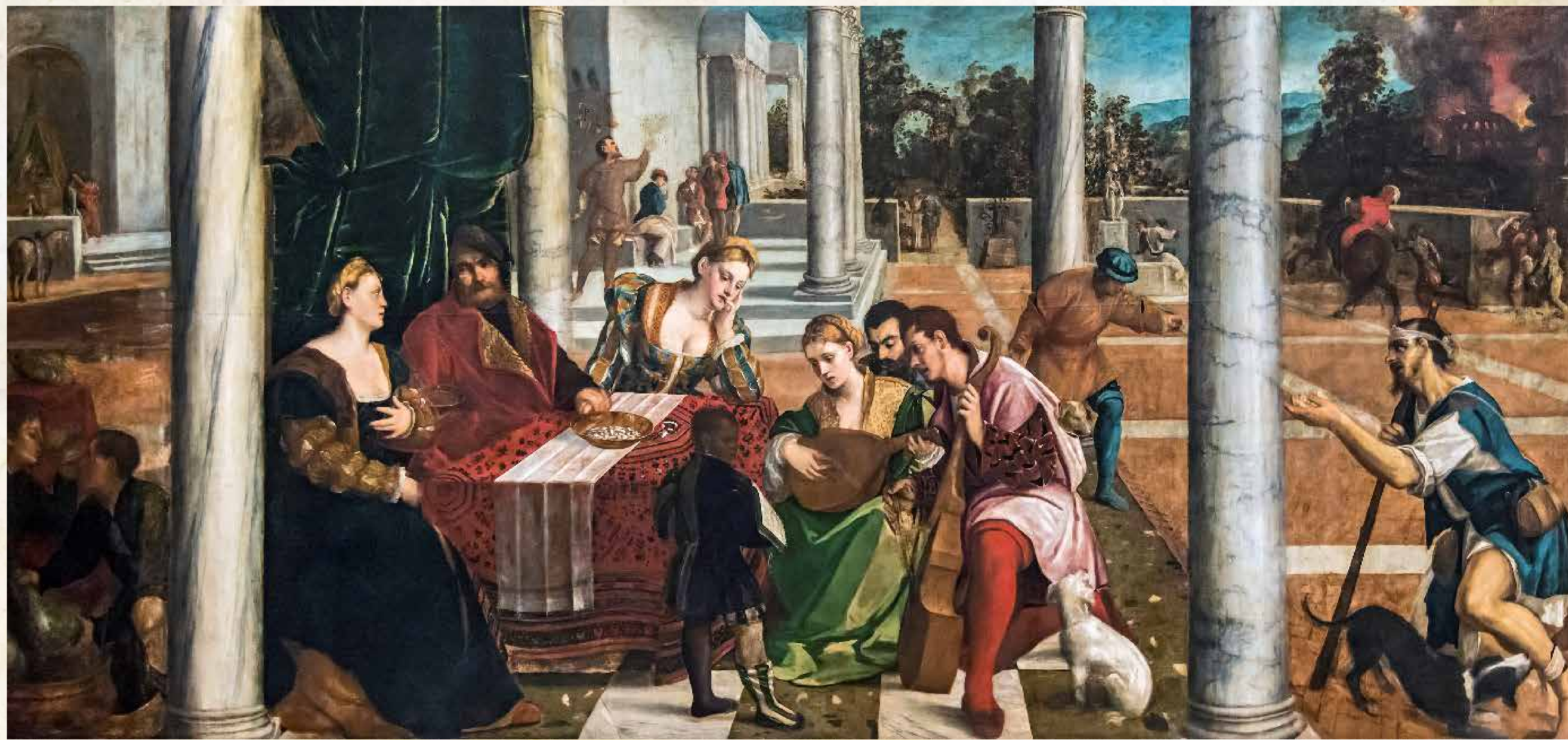
Obr. 4 – obraz „Il ricco Epulone“ od Bonifacia de Pitati (Bonifacio Veronese, 1487–1553), vyobrazená dívka s loutnou má být údajně Gaspara Stampa.

K onec života a smrt Collaltina Collalta je dodnes opředen tajemstvím. Není totiž známo kde a kdy zemřel, ani kde je pochován. Protože však svou poslední vůli nadiktoval roku 1569 v Mantově, patrně zemřel nedlouho po jejím sepsání právě v tomto lombardském městě.