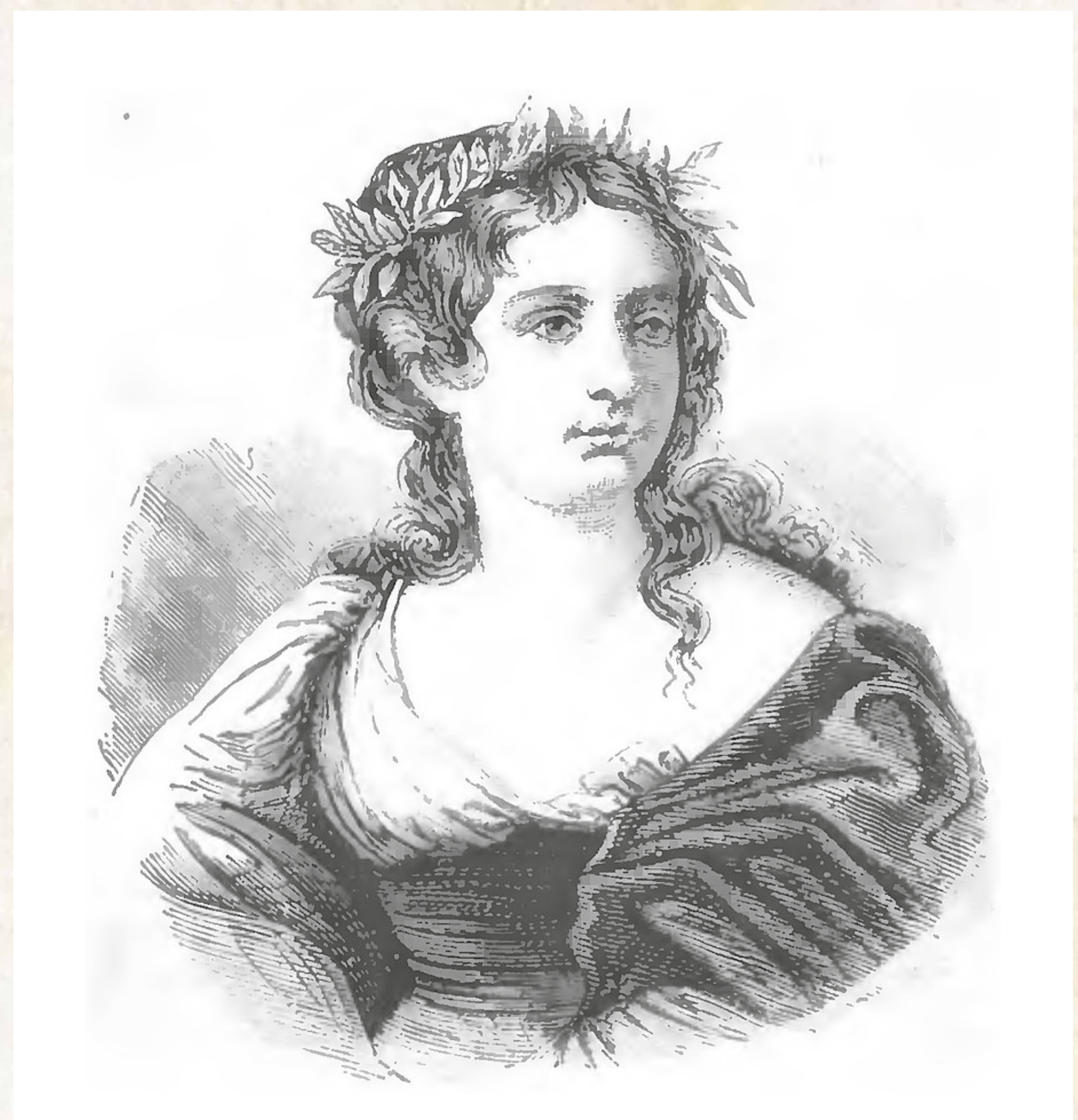
Obr. 2: Portrét Gasparý Stampy z knihy Camerini – Donne Illustri

mi verši, které doprovázela hrou na loutnu. Zde se také setkala s Collaltinem, s nímž pak pobývala na hradě San Salvatore. Jejich vztah však pro častou nepřítomnost hraběte trpěl a roku 1551 vyhasl úplně. Gaspara svůj žal poté vtiskla do svých básní, které psala až do své smrti v roce 1554. Po smrti Stampy se Collaltino v roce 1557 oženil s markýzou Giulii Torrelli, která mu porodila čtyři syny a tři dcery. Collaltino během svého dobrodružného života zplodil minimálně jednoho levobočka, na kterého pamatoval ve své závěti.