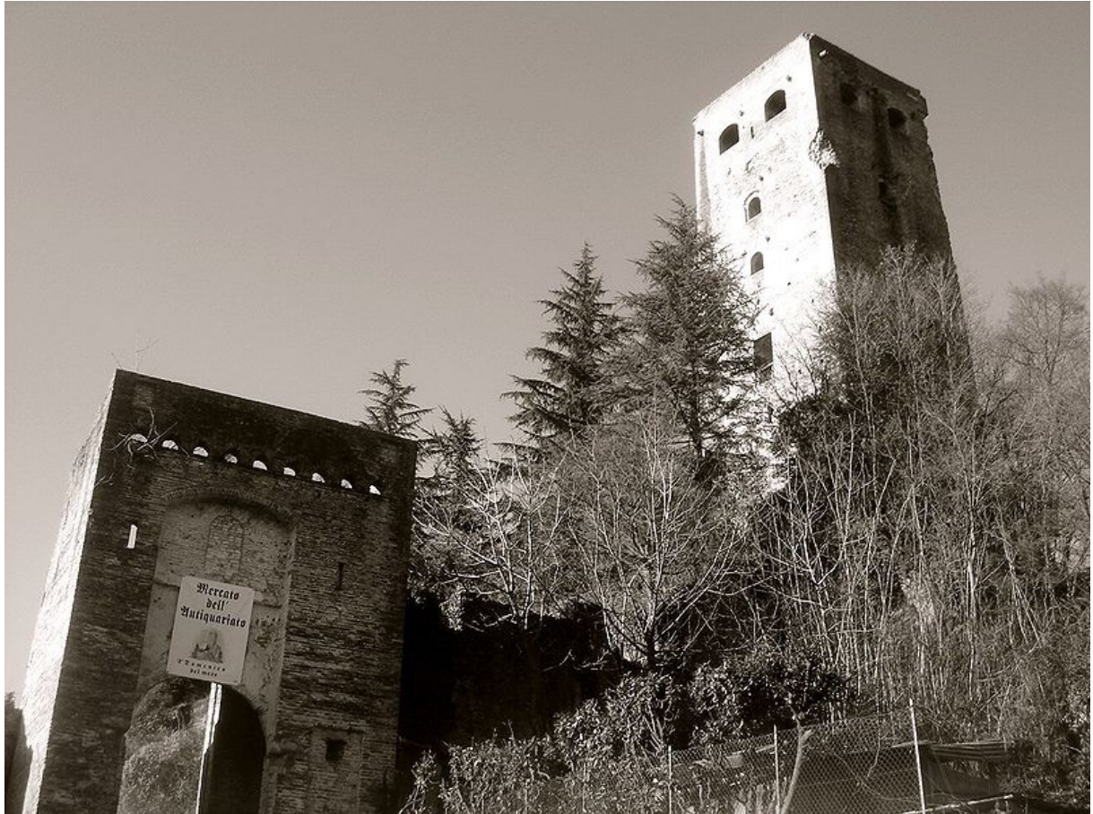
2 Hrad Collalto