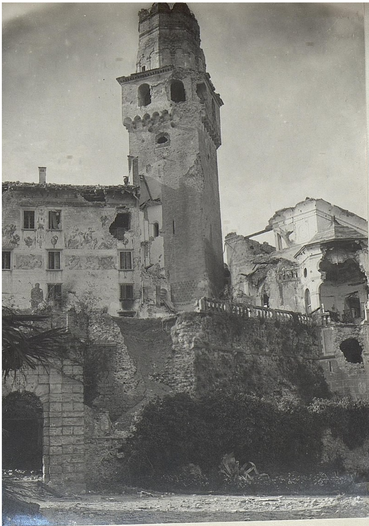
4 Hrad San Salvatore během první světové války