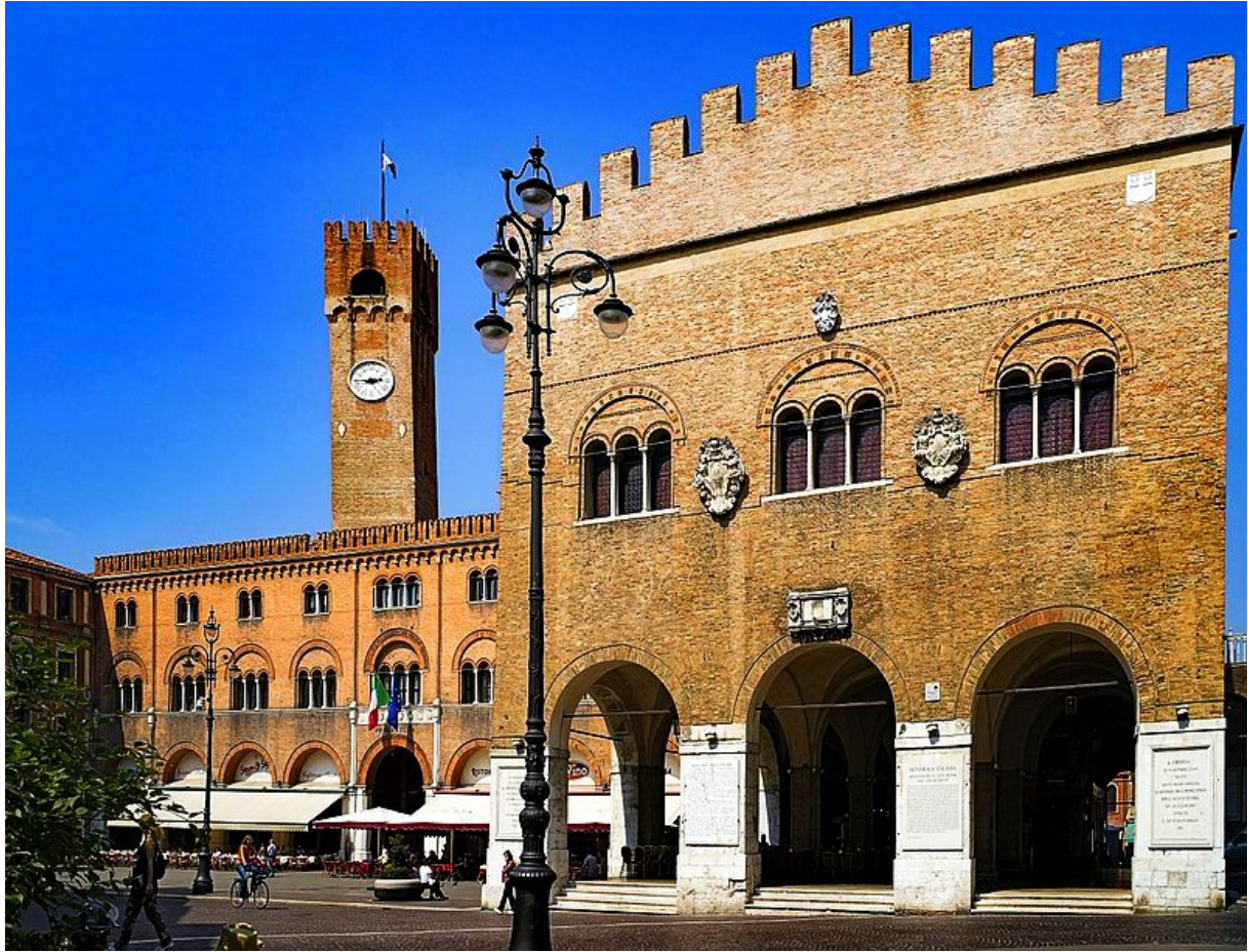
1 Piazza dei Signori, Treviso