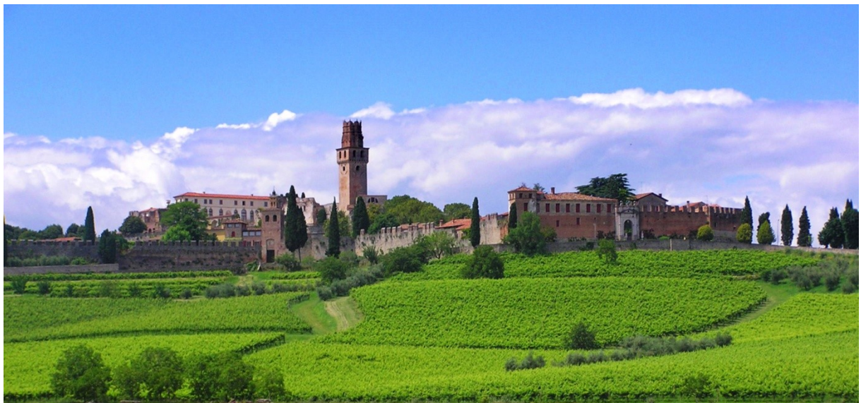
3 Hrad San Salvatore