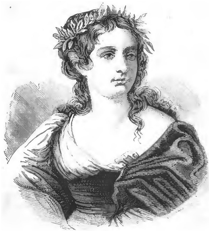
Obr. 2: Gaspara Stampa