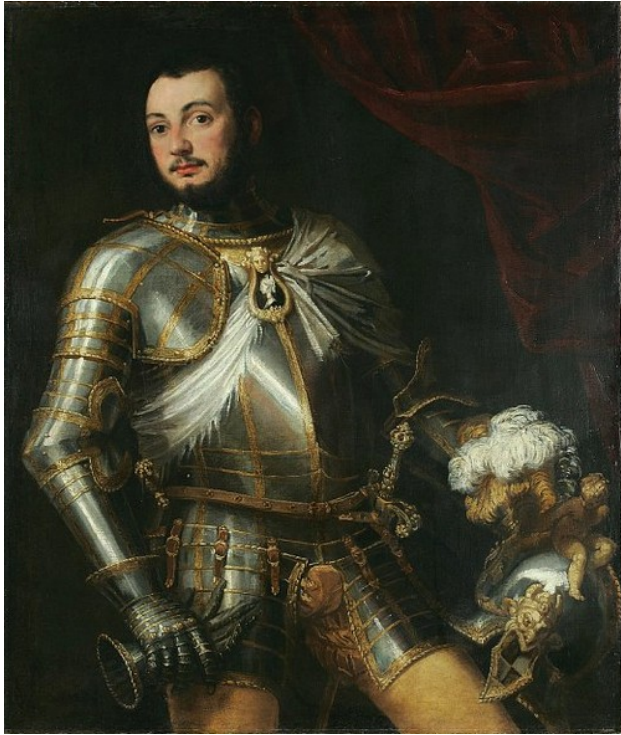
Obr. 1: Portrét Collaltina Collalta