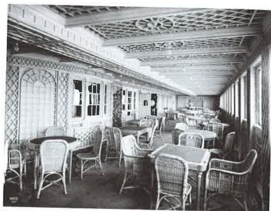
4. Titanic, Café parisien