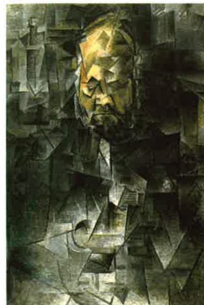
5/ Pablo Picasso, Portrét Ambroise Vollarda, 1910. Puškinovo museum výtvarných umění, Moskva