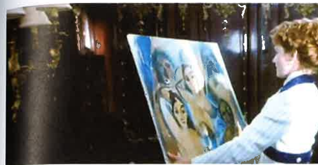
1/ Rose (Kate Winsletová) s variantou Avignonských slečen Pabla Picassa z filmu Titanic (1997)

necklace. Cameron made not only the sketch of Rose with the necklace, but also all the other drawings in Jack's sketchbook. The director himself is Picasso's competitor. Cameron handles Picasso and his two paintings on board like a thematization of radical Modernism, which, in the film, goes to the bottom of the ocean like the ship. Modern art survives, however, whether Cameron intended or not. In view of the fact that the original of Les Femmes d'Alger was in 1912, in Picasso's studio in Boulevard de Clichy in Paris and Cameron actually sank only a variation on the picture, nothing therefore happened to Modern art on board of his Titanic. Here is demonstrated the power of Modern art via variations and cyclical repetition of motifs, alongside the period of modernity, in which the role of copies, citations and technical reproducibility came to maturity. The Titanic was unique, irreproducible and could not be rebuilt. Modern art is unsinkable – it lives on despite the fact that a couple of Picasso paintings were sunk in the film.