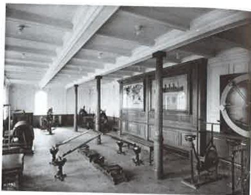
3. Tělocvična na Titanicu