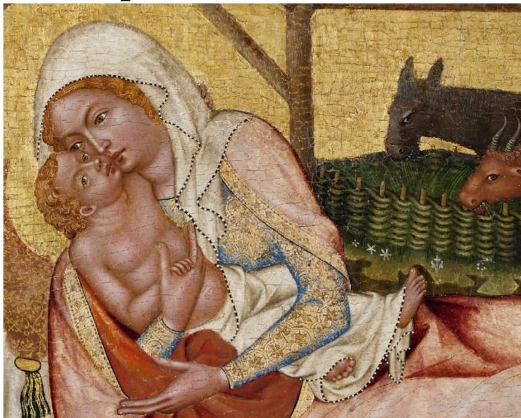
Vyšebrodský cyklus, Narození Páně

Parvulus nobis nascitur, De virgine progreditur Ob quem laetantur angeli Gratulemur nos servuli, Trinitati gloria In sempiterna saecula.