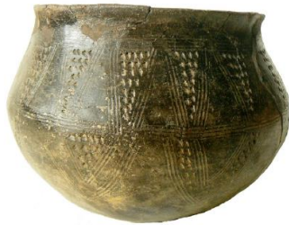
Obr. 35: Příklad nádoby zdobené trojúhelníky vyplněnými klinovými vpichy, Lužice h. 55.