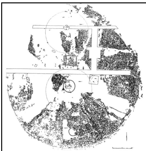
kamenné mauzoleum hrobky