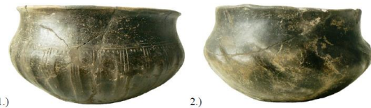
1.) 2.) Obr. 42: Příklad zlábkované výzdoby. 1 = svislý promáčknutý zlábek, Lužice, h. 94; 2 = šikmý vhloubený zlábek, Lužice, h. 3.