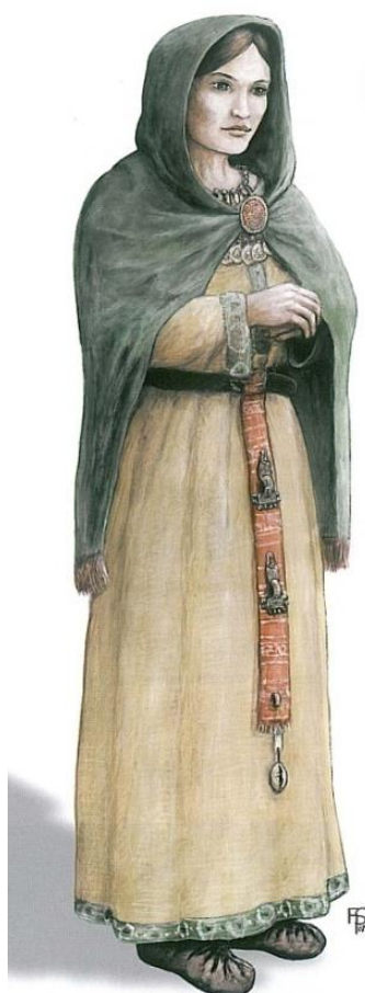
4 ABB 2 der Fra Grab 1;

spony – jeden pár malých spon spočíval na hrudníku – esovité nebo deštičkovité, a sepínal blůzu, druhý pár velkých spon se nacházel v oblasti pánve nebo ještě někdy pod ní (v oblasti stehen) a sepínal suknič, nebo byl připevněn k pasu (Droberjar, E. – Matoušková, A. 2013: Oděv a šperk langobardských žen. Živá archeologie 15/2013, 53-56.)