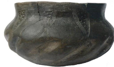
Obr. 43: Příklad kombinace zlábků a ryté výzdoby, konkrétně motivu zavěšených trojúhelníků vyplněných klinovými vpichy.