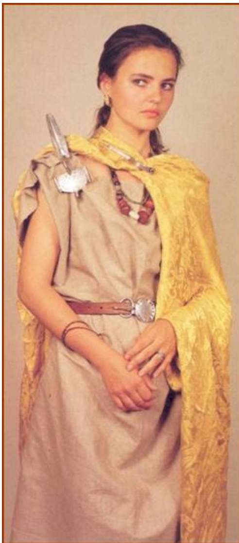
(rekonstrukce kroje ženy ze Smolína)