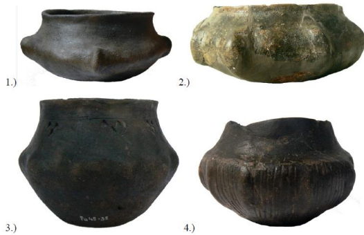
Obr. 45: Keramika zdobená plastickými žebry. 1 = Borotice h. 27/XXII; 2 = Lužice, h. 55; 3 = Šarátice, neznámý hrob; 4 = Holubice, h. 55.