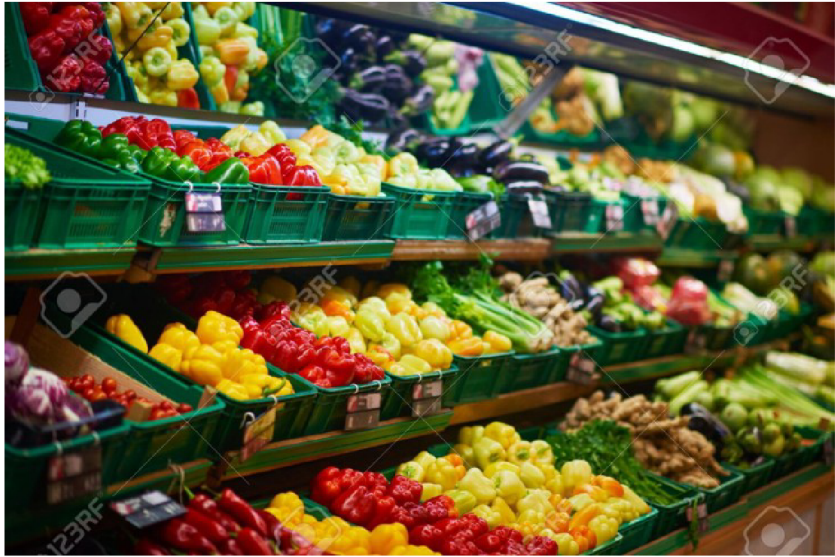
食料品 (しょくりょうひん)