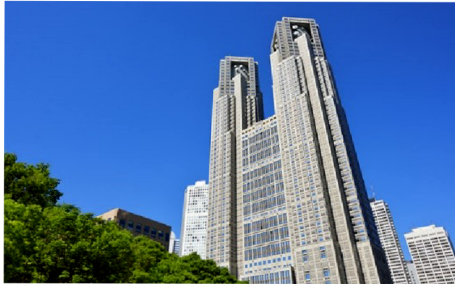
東京都庁 とうきようとちよう ：新宿にある、Tokyo Metropolitan Government

1. 男のひとと女のひとが東京の都庁 とちよう へ行きました。二人の会話を聞いて、1970年ごろの新宿 しんじゆく の絵をえらんでください。(Audio ; Tokyo Tocho Audio 1)