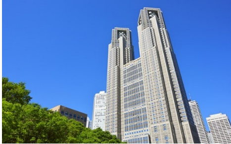
東京都庁 とうきようとちよう ：新宿にある、Tokyo Metropolitan Government

1. 男の人と女の人が東京の都庁 とちよう へ行きました。二人の会話を聞いて、1970年ごろの新宿 しんじゆく の絵をえらんでください。(Audio ; Tokyo Tocho Audio 1)