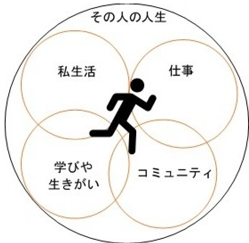
<ワークライフインテグレーション>